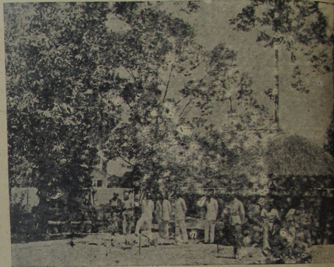
Parque de recreio