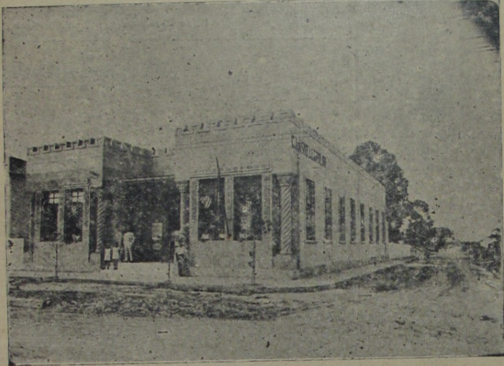
Fachada do Ginasio

Jornal, em cujo programa figura em primeiro plano a INSTRUÇÃO E EDUCAÇÃO DO POVO, — "Correio da Lavoura" tem publicado, em seus numeros anteriores, suas impressões e noticias sobre o "Ginasio Leopoldo". E o tem feito com entusiasmo e satisfação, porque reconhece, nesse estabelecimento, um educandario modelo, de que se pode orgulhar o Municipio de Iguassú. Hoje, que dispomos de maior espaço, inserimos uma reportagem mais pormenorizada, ilustrada com clichês e algumas informações de real utilidade para os que pretendam nele matricular seus filhos.