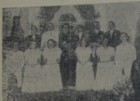
Os membros da mesa que presidiu a brilhante solenidade de sabido, e os Peritos Contadores em pose especial para o photographo