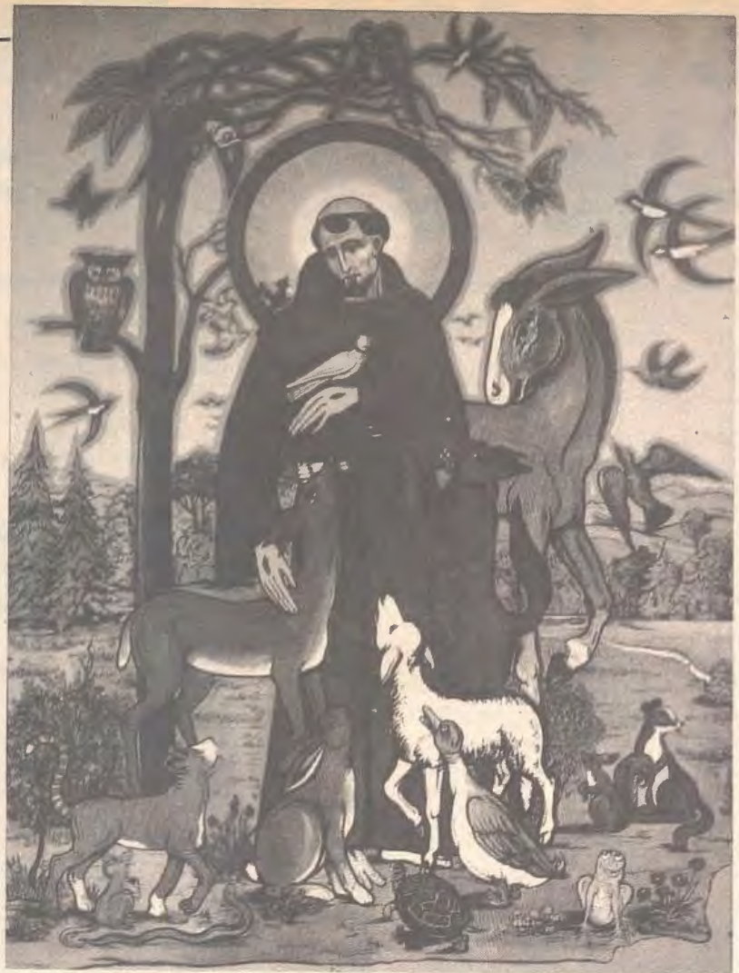
"Louvado sejas, meu Senhor, no conjunto de Tuas criaturas!"

*No dia 20 de maio a Associação Beneficente São Martinho inaugurou, na rua Sílvio Romero, 49, em Santa Tereza - RJ, a sua segunda "CASA & COMPANHIA" - Casa São Martinho, destinada ao acolhimento noturno de meninos de rua.