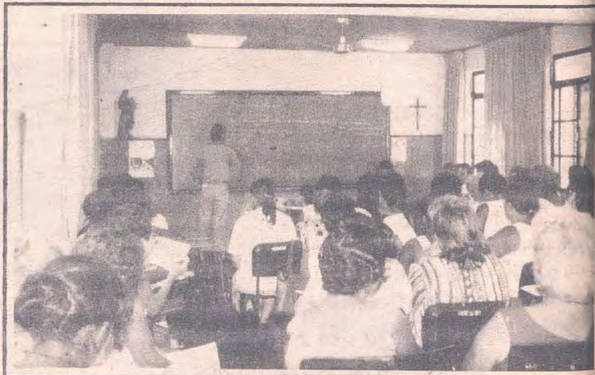
Dia de Formação para os Missionários de Santa Rita

Sant'Ana é uma pequena mas acolhedora comunidade, caminhando lentamente na Luz da Fé, formada de um povo simples mas amado por Deus.