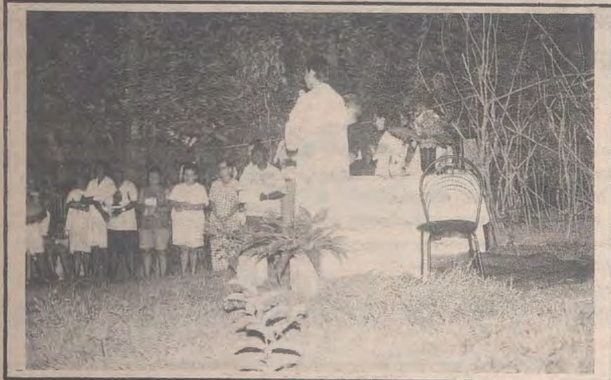
Missa das Missões no Bairro Pacífico

Em 1995 começamos dentro da nossa Paróquia duas áreas de Missão: O Bairro Pacífico e algumas ruas no Centro de Corumbá. Seguimos os seguintes passos: