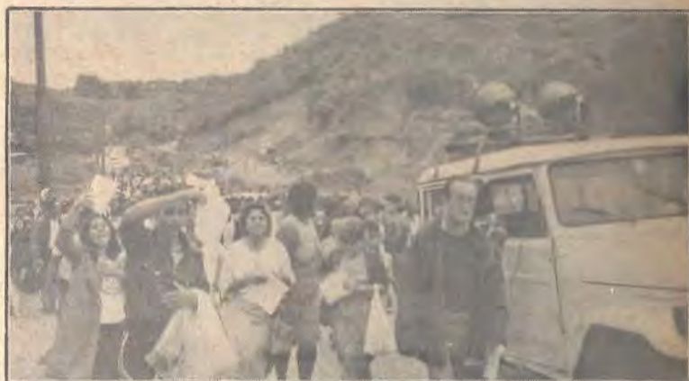
Deus caminha com seu Povo (Leia na página 3)