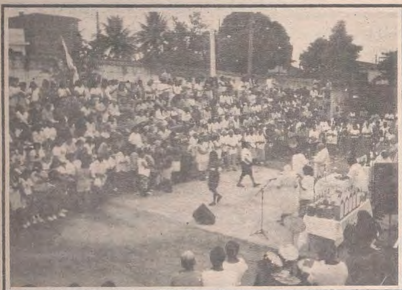
Paróquia Cruzeiro do Sul, envia Missionários na comunidade Nossa Senhora Aparecida

A Paróquia Cruzeiro do Sul, celebrou o envio dos animadores missionários, na comunidade N. S. Aparecida. As 10 comunidades estavam representadas com 30 capelinhas. A celebração foi muito animada e participada.