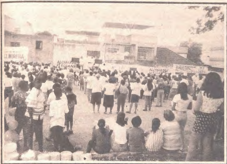
Paróquia São Sebastião celebrando a abertura em campo aberto

A Paróquia de São Sebastião, celebrou o envio dos missionários em campo aberto. Foi uma celebração participada e alegre. O momento marcante, foi quando cada núcleo entrou com um balde de água para encher a talha grande, seguida da bênção da água. No final, encheu-se as talhas pequenas dos 11 núcleos fazendo o envio das capelinhas e dos animadores.