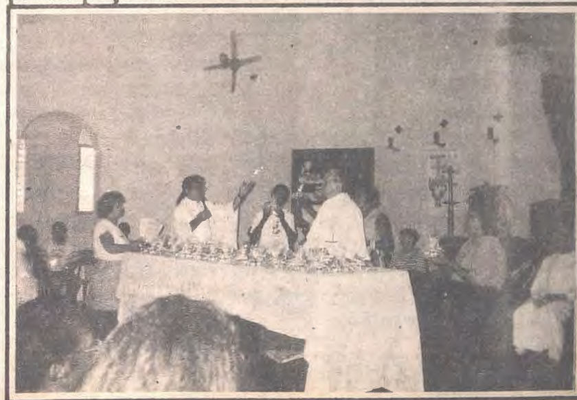
Celebração de entrega dos Santos Óleos

Os representantes de todas as Paróquias, às 15:00h, numa celebração simples e bonita, receberam os Santos Óleos, levando-os às suas comunidades. A cada ano, esta celebração, da entrega dos Santos Óleos, vêm ganhando força, pois é feita com zelo e participação.