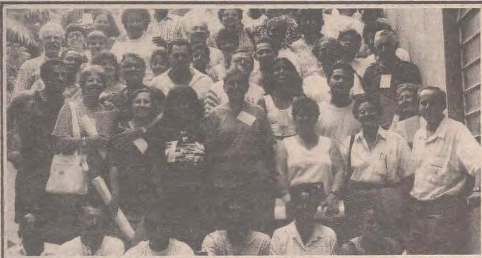
Participantes da 8ª Assembléia Regional de Leigos

autorizados pelo Senado e com a participação direta de secretários de finanças das administrações de alguns Estados e municípios.