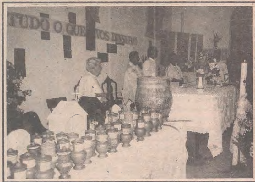
Paróquia Santa Maria, Belford Roxo, envia 60 Missionários

A Celebração de abertura em Santa Maria, foi um momento marcante, que entusiasmou o trabalho missionário na paróquia. No ato penitencial foi lembrado o que pode atrapalhar as Santas Missões ( novela, comodismo, alienação). No ofertório alguns símbolos lembraram o significado das Santas Missões Populares, capelinhas, as talhas, o Rosário, os subsídios e o projeto da Pastoral da Juventude.