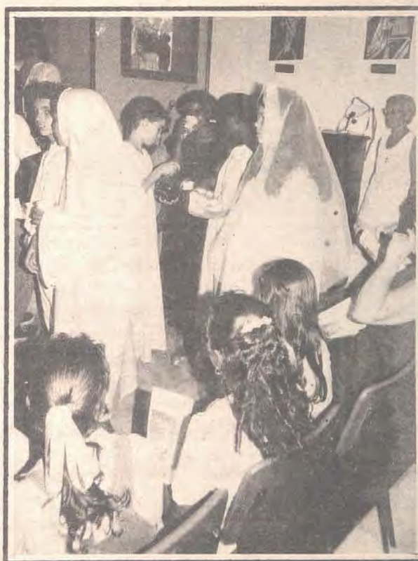
Encenação das Bodas de caná no envio das capelinhas aos núcleos.