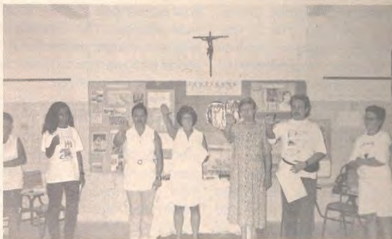
Celebração de encerramento da 2ª Escola de Fé da Região II