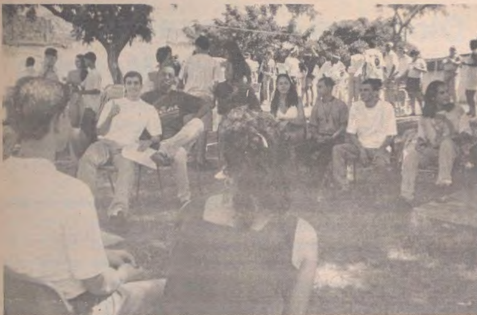
Jovens da Região I, no Dia 1º de maio em Mesquita