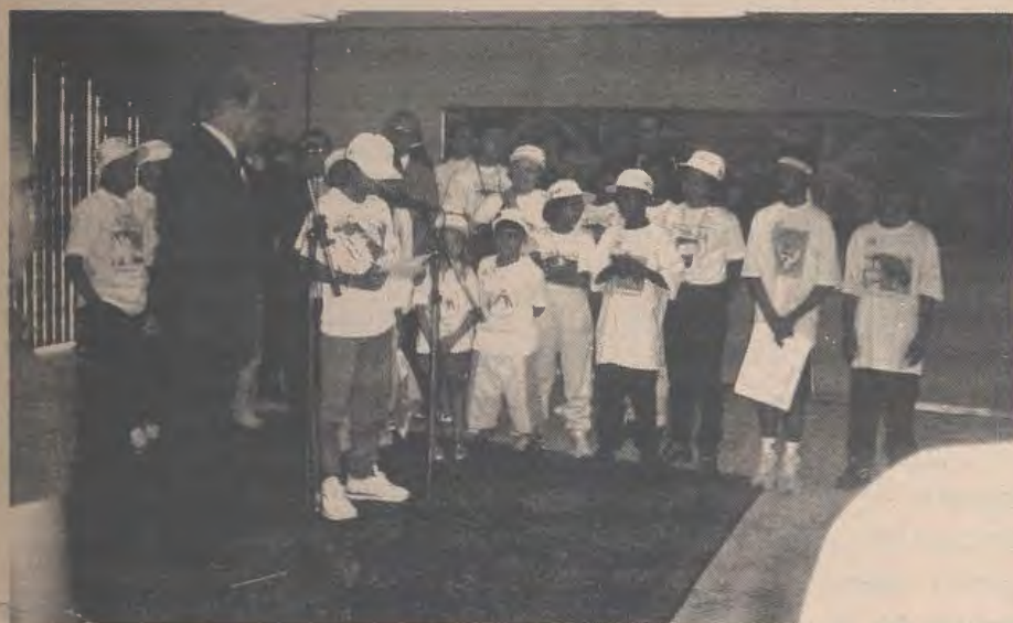
Participantes da Marcha Global contra o Trabalho Infantil com o Presidente Fernando Henrique

Um grupo de 46 crianças, adolescentes e educadores da AVICRES e CASA DO MENOR, participaram da Marcha Global contra o trabalho infantil que aconteceu em Brasília, no dia 13 de maio. Eles uniram-se a milhares de crianças, provenientes de todas as partes do Brasil, para dizer Não ao trabalho infantil! Não ao trabalho de crianças com menos de 14 anos!