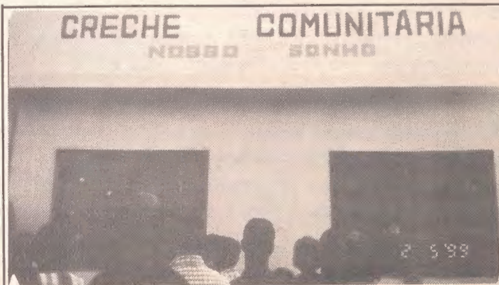
Inauguração da Creche Nosso Sonho