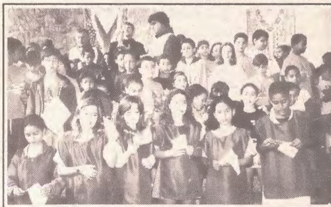
Em Nilópolis, crianças da catequese celebram Pentecostes e vibram com Santo Antônio

Que a passagem das relíquias de Santo Antônio se tornem incentivo e bênção à Diocese de Nova Iguaçu e a todas as outras dioceses por onde passarem. Que o modelo de Santo Antônio sirva para nos animar cada vez mais na missão que Deus nos dá.