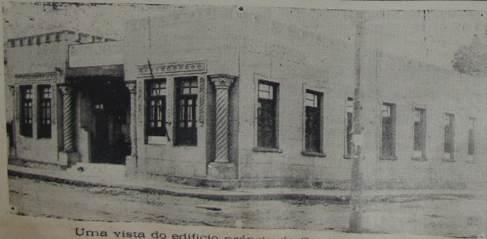
Uma vista do edificio próprio do Cinásio Leopoldo