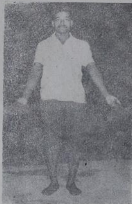
Este cidadão enfrentou um tremendo lamaçal para falar ao JH.