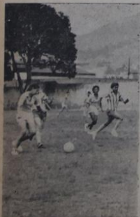
Nessa jogada, as meninas reprimiram alguns lances do Maracanã, em dia de Fla x Flu.