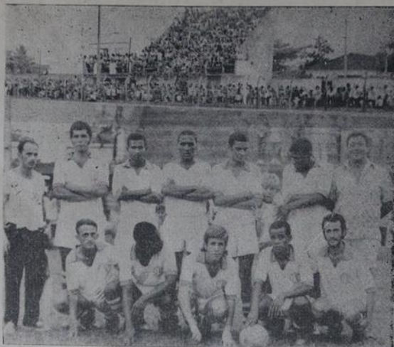
Esta é a equipe que venceu a Seleção de Nova Iguaçu por 2x1.