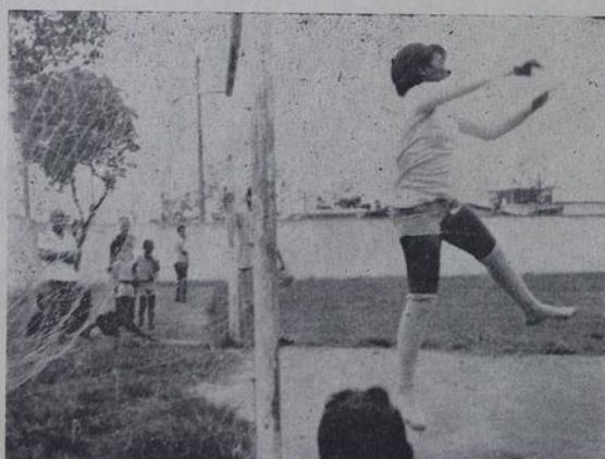
Apesar do esforço da goleira do Nova Cidade, não foi possível fechar o arco, deixando passar seis "penosas".