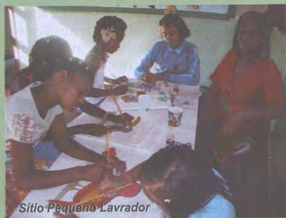
Sítio Pequeno Lavrador

A Avicres possui seis Projetos Educacionais para crianças e adolescentes carentes da