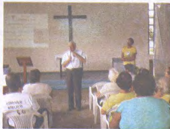
Retiro Diocesano de 2012

JÁ COMEÇARAM A FORMAÇÃO BÍBLICA NAS PARÓQUIAS. Pedimos a todos que mande as informações de seus encontros.