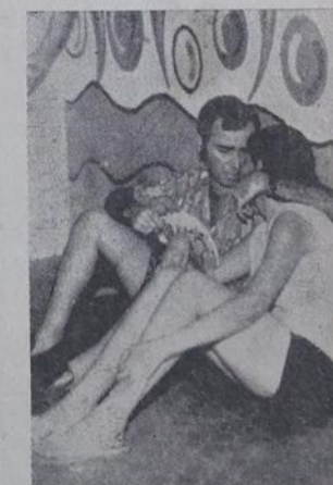
Paz e Amor no "Filhos de Iguaçu"