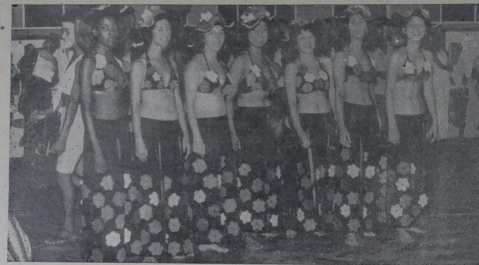
Diretores do Nova I. Country Club que foi o grande destaque de carnaval dos clubes iguaçuanos.

BELFORD ROXO — com um palanque armado na praça Getúlio Vargas, trânsito desviado do centro e muita "gente boa" nas ruas, viveu um bom carnaval. As principais figuras da