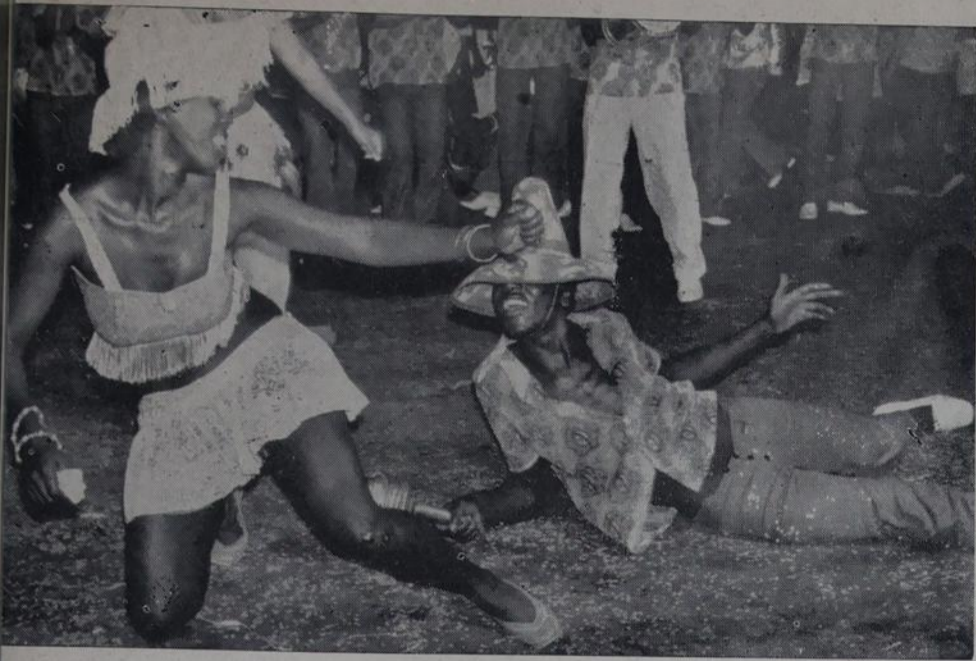
Estes dois ao som da cuíca e tamborim da Grande Rio, deram um plá de samba e dança.