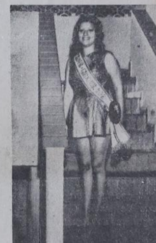
Alegria no "500"