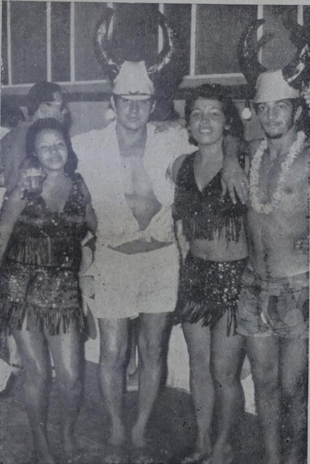
No Carnaval os "chifrudos" também brincam.

dem e disciplina em toda a área daquele populoso 2º Distrito.