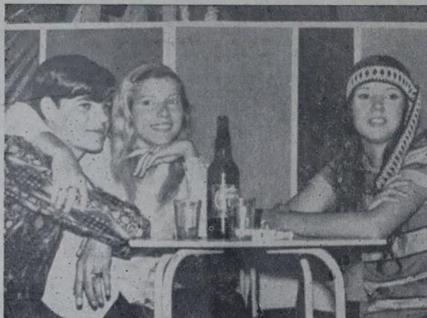
Amor puro no IBC.

ENGENHEIRO PEDREIRA — pouco além de Queimados, mais conhecido como Caramujos, a sua principal praça — Olavo Bilac — contou com muita mulher, principalmente das que ultrapassaram os "30". Ali ainda se registrou a