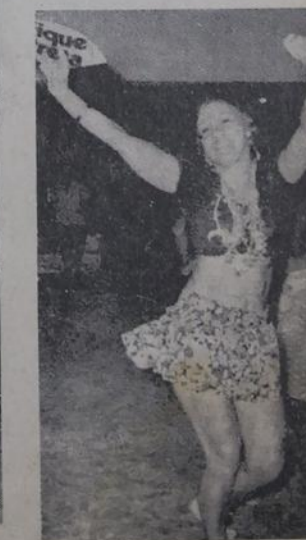
Alegria e muita curtidão!