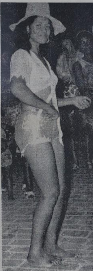
A mulata do "Leões de Iguaçu" em pose especial