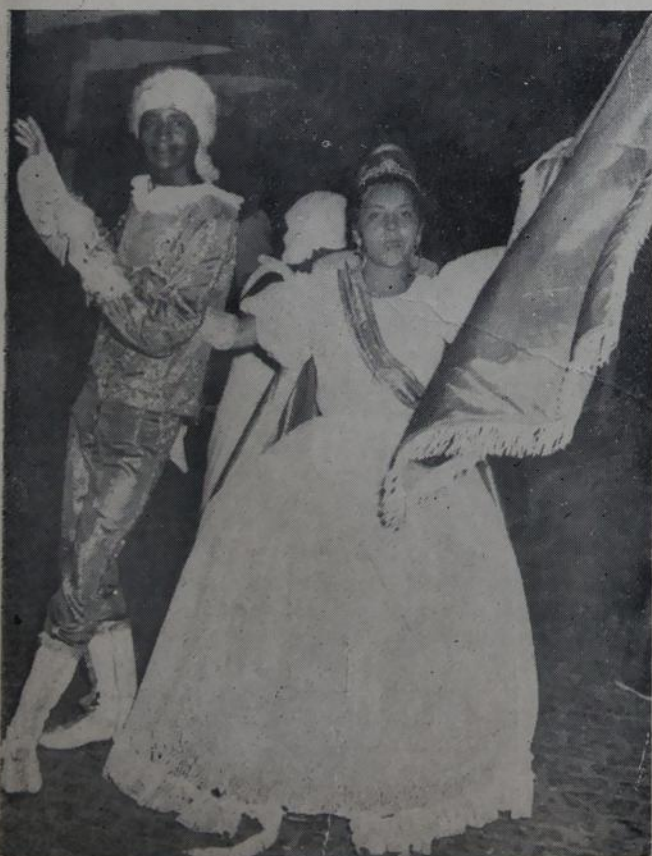
Destaque do bloco vencedor do desfile, em Mesquita.