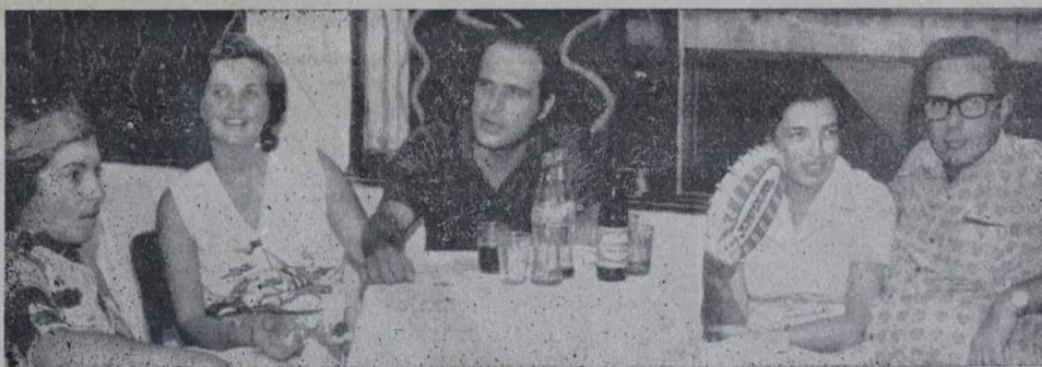
Sociedade iguaçuana presente no N. I. Country Club.

A diretoria resolveu oferecer ao Bloco Criação, um troféu, já que se destacou dos demais grupos em animação, o que foi bem recebido pelos seus 70 componentes, e pela multidão que acorreram ao Mesquita.