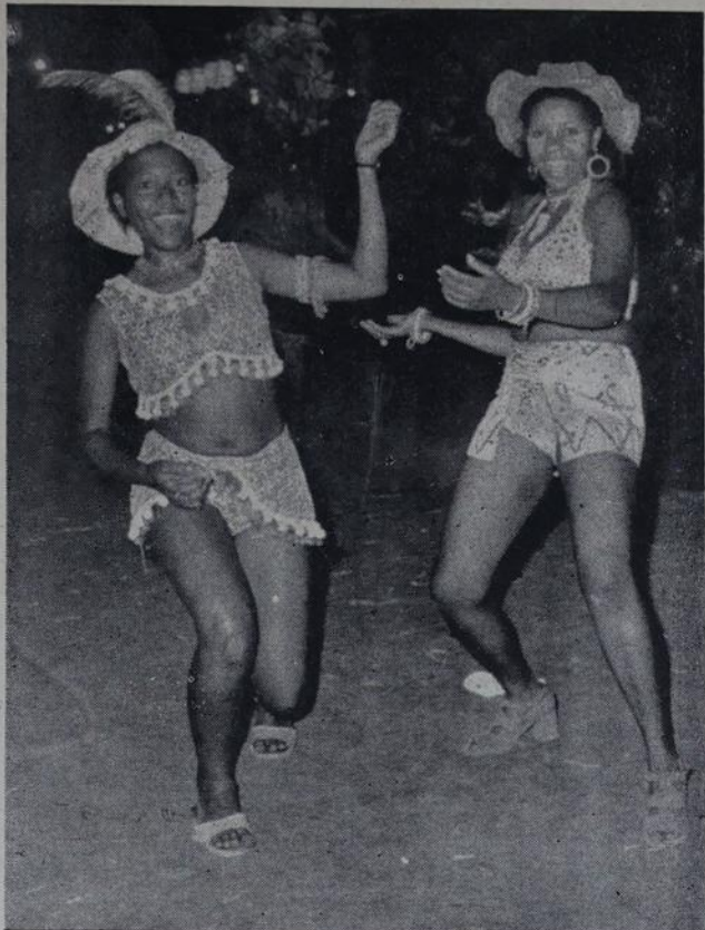
OH! MULATA ASSANHADA — Que mexe com a gente e bota prá quebrar no asfalto quente da Avenida.

Mas o ponto alto do desfile foi o desfile do tradicional bloco caxiense Tigre de Caxias, composto pelos jornalistas