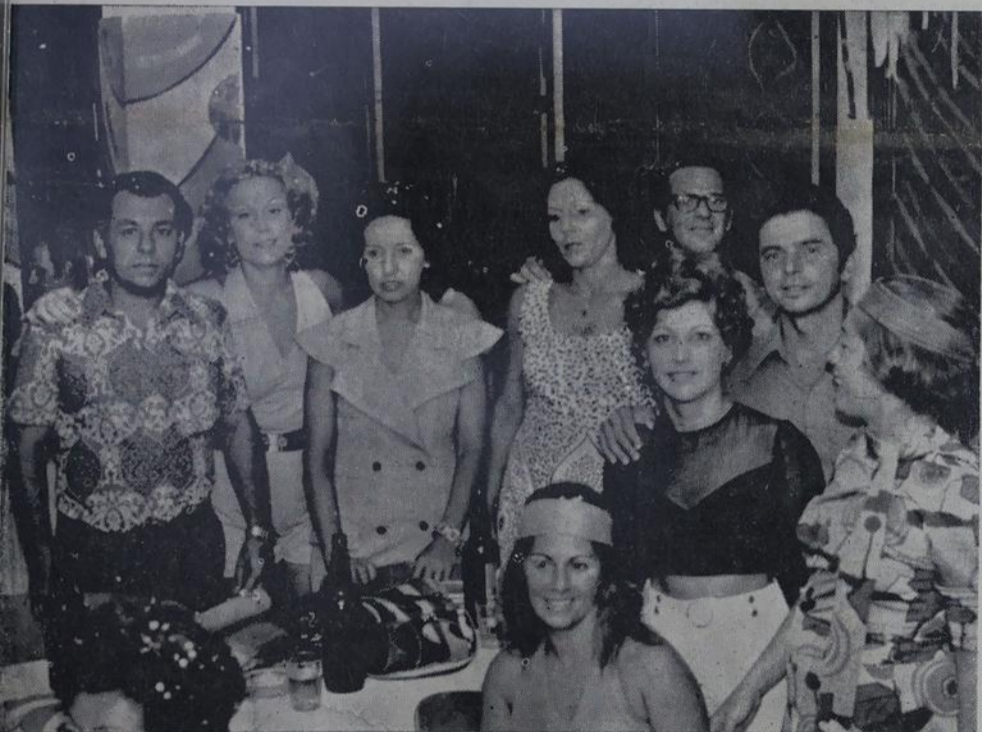
Diretores do N. I. Country Club que foi o destaque de carnaval dos clubes iguaçuanos.