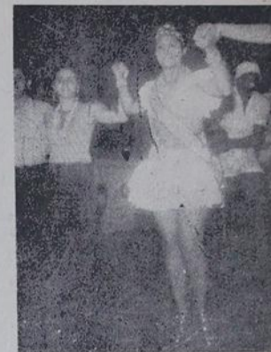
Vamos brincar o carnaval!