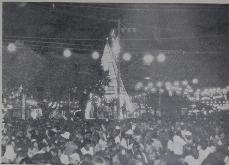
Aspecto noturno do carnaval na Praça da Liberdade, em Nova Iguaçu — A Cidade Ternura.

A índia da foto, mostrando tudo de bom que tem, deixou cair. Para amenizar o calor, os foliões consumiram alguns milhares de garrafas de cerveja, o que aumentou ainda mais a animação do Carnaval.