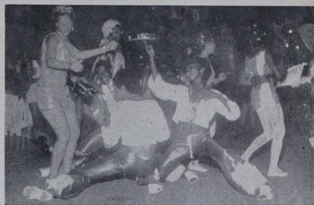
O pessoal do Unidos de Santa Lúcia campeão de carnavais passados deram lição de ritmo e dança na Avenida