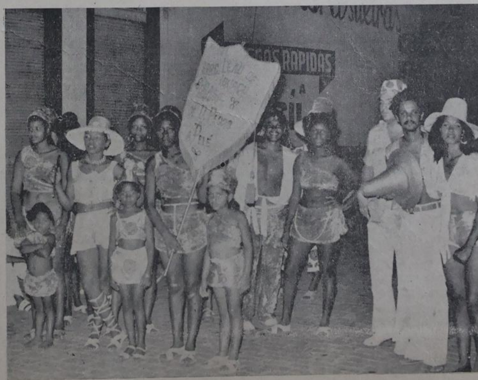
Componentes do popular bloco "Leões de Iguaçu" que deverá abiscoitar a primeira colocação depois da brilhante apresentação na Praça Onze.