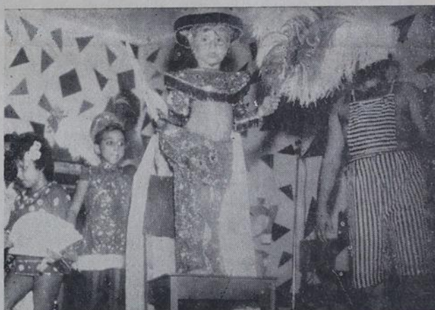
No Recreativo este menino fez sucesso com sua fantasia de Mandarin.