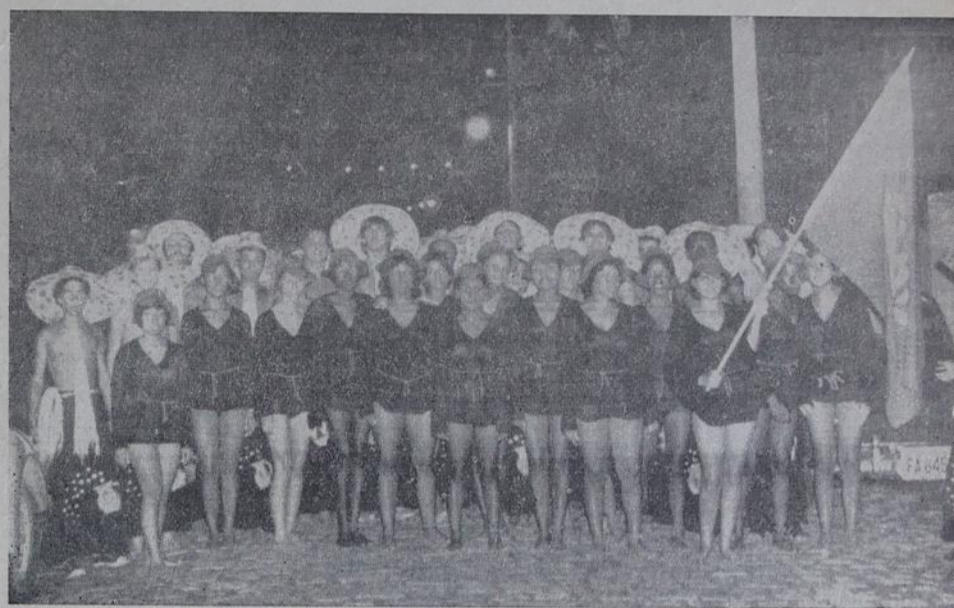
Os Filhos de Iguaçu F. C. também teve o seu bloco.