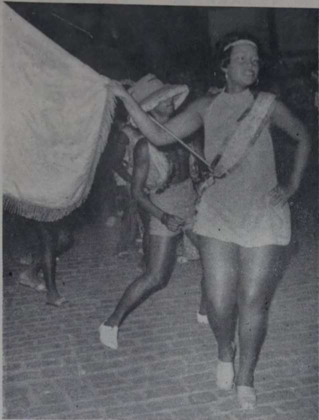
Mesmo sem tablado, as meninas do samba deixaram cair sobre pedras.

Depois de mais de uma hora de espera, ouve-se os primeiros sons da bateria da Imperatriz do Engenho Pequeno. Com o enredo "Festa da Penha de Ourora", numa escolha muito feliz, a Imperatriz apresentou um ótimo Carna-