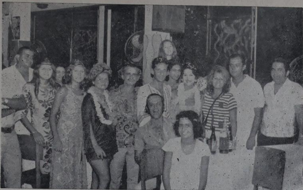
A Sociedade Iguaçuana prestigiou o Carnaval do Country.