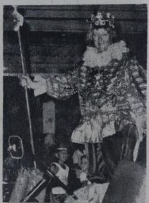
O povo vibrou com a "Outra Fôrça do Brasil" que a turma do Grande Rio cantou na Avenida.