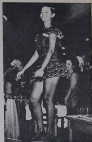
Reinado no Recreativo