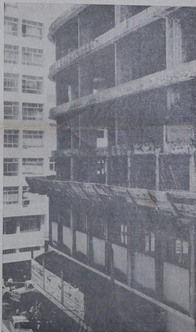
Prédios inacabados, vergonha da 8ª cidade do Brasil e prejuízo para centenas de bem intencionados compradores. Página dez.