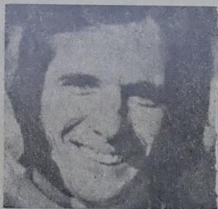
Primeiro do mundo

Depois só faltará o problema da suspensão de sua Lotus.