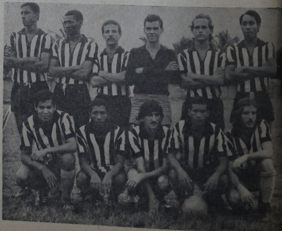
Empate basta. Mas o Mesquita quer mais: diz que vence Heliópolis.

mas com a desistência do rubro-negro da Chatuba, que foi multado em Cr$ 200,00 e ainda poderá ser punido pela JDD, o Volantes ganhou os pontos sem qualquer esforço. Na Chave Mêmio da Glória, que já tem o Queimados como campeão, será cumprida a última rodada do retorno com os jogos: 15 de Novembro x Queimados e Morro Agudo x Ferroviário.