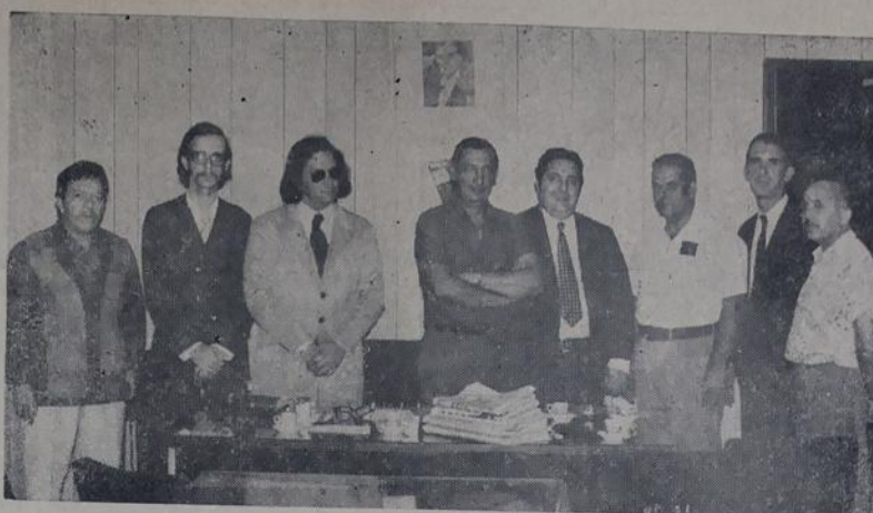
Uma foto histórica: aqui se começou a tratar, em Nova Iguaçu, dos destinos do Autódromo de Adrianópolis.

Av. Carlos Marques Rolo, 101 — NOVA IGUAÇU