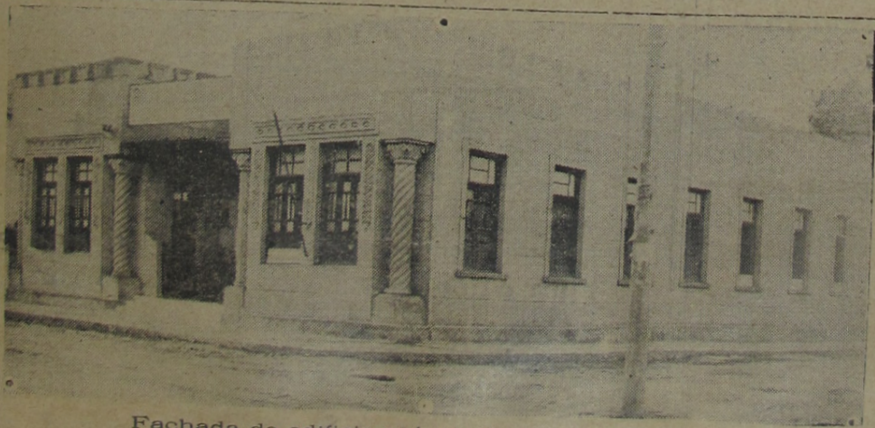
Fachada do edificio próprio do Ginásio Leopoldo

Ao poeta de "Saudade", as felicitações da Direção Técnica do Ginásio Leopoldo pelo transcurso desse aniversário - felicitações que têm a finalidade de compartilhar as alegrias de vitória do homenageado de colocar, bem alto, um modelo de quanto pode o idealismo sadio a serviço do Brasil e da humanidade.