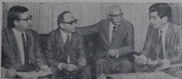
A palestra informal.