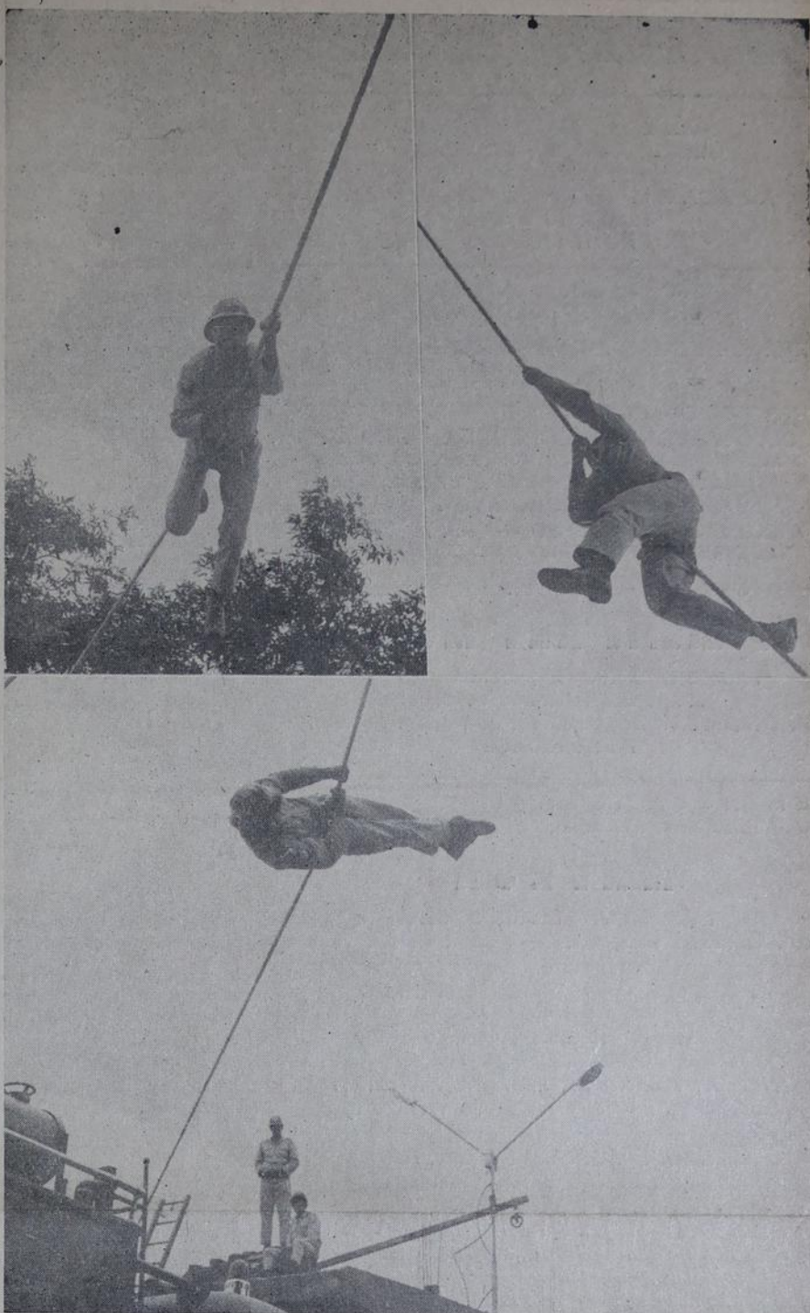
TRANSPosição DE OBSTÁCULOS