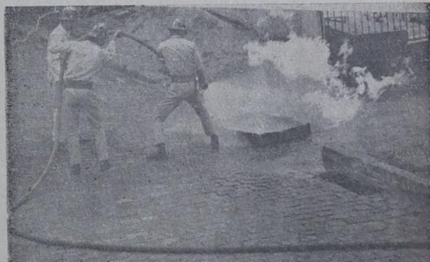
DEMONSTRAÇÃO DE COMBATE AO FOGO