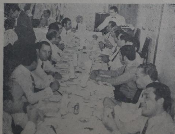
Aspecto do almoço.