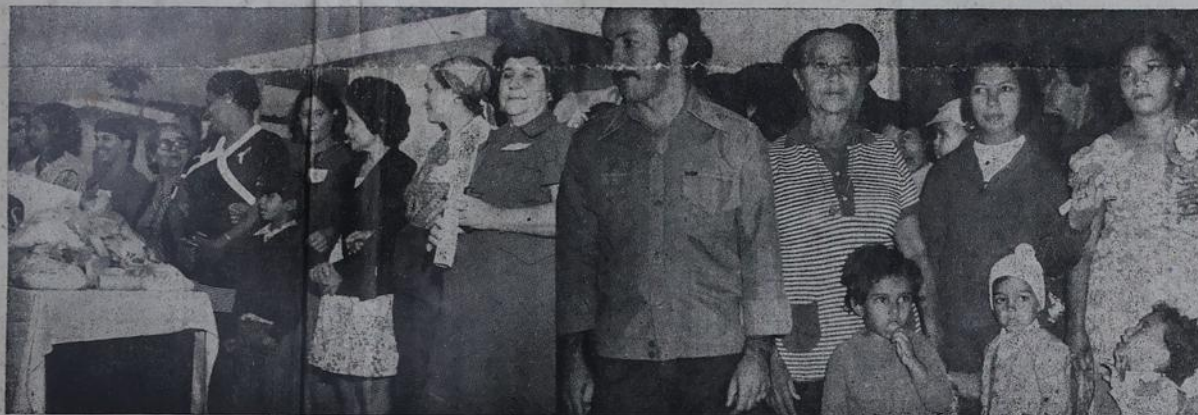
Um selecionado grupo de mães pobres recebeu, do Instituto Educacional de Mesquita, mantimentos e flores, no dia que lhes é dedicado. Toda a direção do colégio participou.