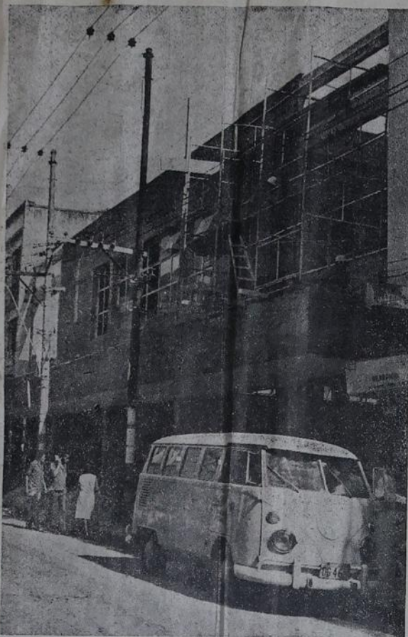
As obras sem proteção sempre foram combatidas pelo JH e agora também, pelo presidente do Sindicato dos Empregados na Construção Civil, que promete levar o drama até o Delegado Regional do Trabalho, citando nominalmente as firmas que não seguem as normas de segurança.

Uma obra localizada na confluência da Avenida Amaral Peixoto com rua Quintino Bocaiuva no centro de Nova Iguaçu, e que funciona sem a tela protetora preconizada pelo presidente do Sindicato dos Empregados na Construção Civil, foi causadora de acidente: uma tábua caiu do 2.º andar ferindo um transeunte. A falta de segurança nas obras de Nova Iguaçu vem sendo vivamente denunciada pelo Sindicato de Classe, que constantemente tem um de seus associados vitimados pelo problema. — (Leia noticiário na pág. sete).