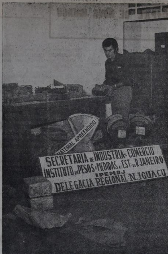
A tristeza da mudança, mostra a realidade do final da batalha

Redação, Composição e Impressão: Rua Kennedy 11 — Bairro Jaqueline. Tel. 2380 — Nova Iguaçu RJ.