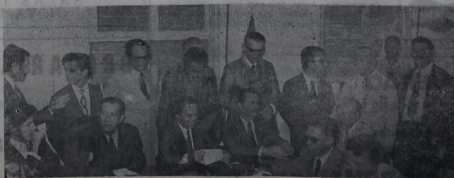
Outro aspecto da saleta da Arena