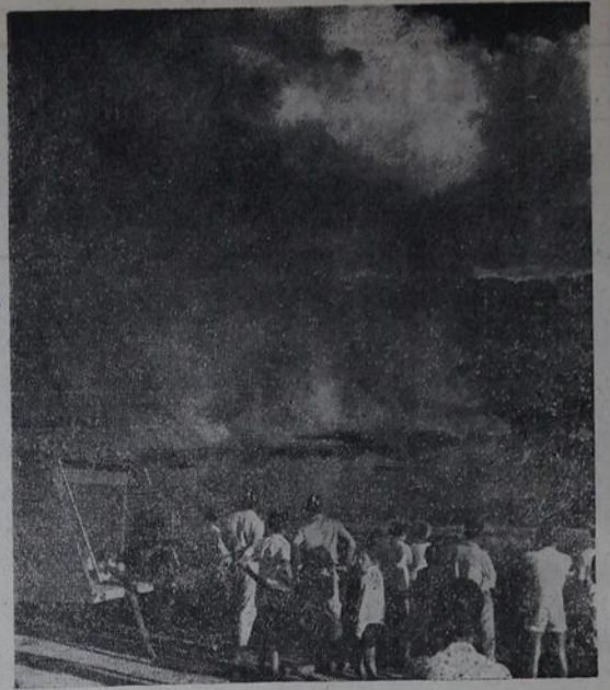
Recentemente, na Avenida Roberto Silveira, o atendimento a um chamado preveniu um possível grande incêndio, quando alguém ateou fogo a um lago de óleo.

A Polícia Militar do Estado do Rio de Janeiro receberá, assim, um efetivo treinado e que tem atendido a população iguaçuana com sucesso, dentro dos recursos limitados de que dispõe. No último mês de abril, por exemplo, — conforme já noticiamos — o Corpo de Bombeiros de Nova Iguaçu atendeu a 75 chamados para as mais diversas emergências, entre as quais oito chamados para incêndio, 19 casos de domínio e transporte de débeis mentais e trinta e seis entregas de água a repartições municipais, estaduais e federais. Neste domingo, um atendimento pronto a um chamado de incêndio em um ônibus, na Estrada de Madureira, evitou que um carro da empresa Nossa Senhora da Glória fosse totalmente consumido pelo fogo.