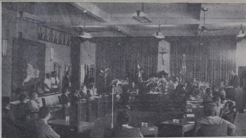
O plenário da Câmara de Vereadores de Nova Iguaçu é um dos mais bonitos e organizado

para a final do concurso que será realizada na cidade de Volta Redonda no mês de junho.