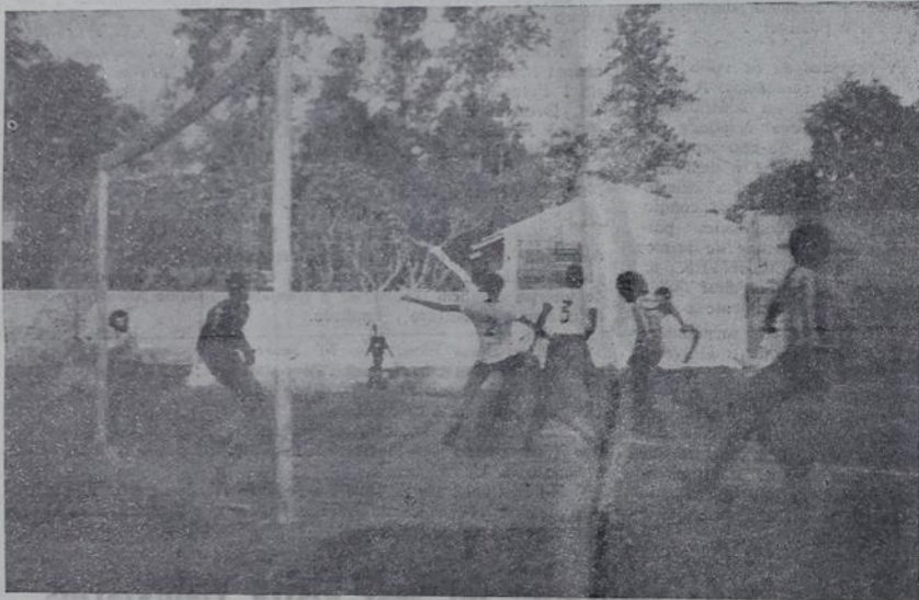
A defesa do 15 de Novembro foi impotente para resistir aos avanços do Morro Agudo, que apareciam em todos os lances de área.

O Morro Agudo marcou, domingo, o mais elevado escorço do Campeonato da Divisão Especial de Nova Iguaçu, ao golear o 15 de Novembro, por 7x0, no Estádio Domingos César de Castilho. O time de Carmari entrou em campo desfalcado e só completou o número legal aos 20 minutos do primeiro tempo.