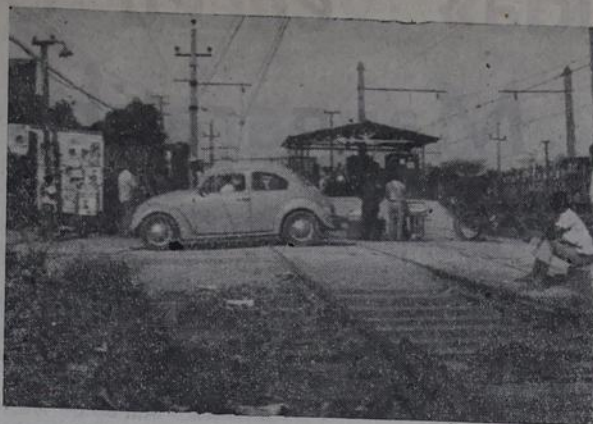
Os carros ficam horas e horas parados, aguardando a abertura da cancela.