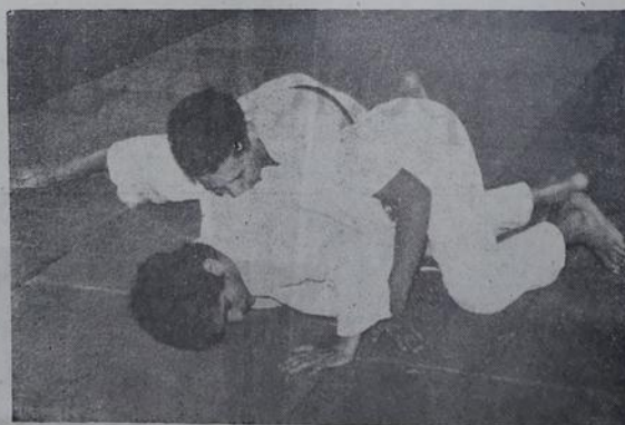
O judoca sai, sensacionalmente, de uma imobilização.

1.º Lugar - Bayer Judô Clube, com 28 pontos, fazendo 2 campees, 1 vice e um 3.º colocado.