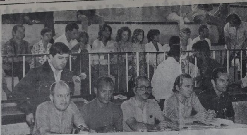
Os mesários têm intenso trabalho durante os encontros do Festival.