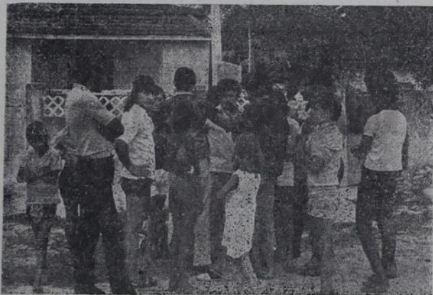
Todo mundo da Posse cercou a reportagem do JORNAL DE HOJE. "Agora acreditamos que vão cuidar do bairro".

Todos os que foram ouvidos pela reportagem acreditam que o Prefeito Joaquim de Freitas, tomará as providências