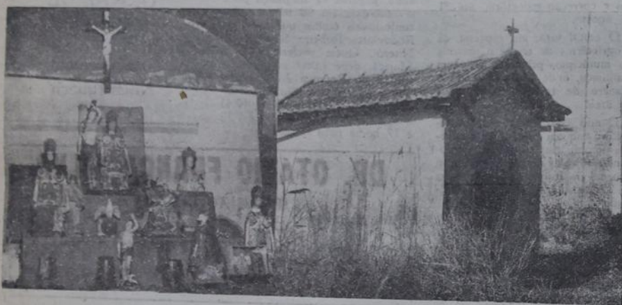
O interior e o exterior da capelinha da Rodovia Dutra

Uma capela abandonada no quilômetro 22 da Rodovia Presidente Dutra, vem recebendo inúmeras visitas, que colocam oferendas a seu redor, afirmando alguns que assim procedem por terem alcançado uma graça, em vista de pedido feito ao transiarem pelo local em caminho para São Paulo.