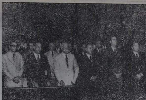
Políticos de Nova Iguaçu, independente de partido, prestaram sua homenagem a Filinto Müller.

No Quartel da Segunda Companhia Independente de Polícia, em Edson Passos, estão à disposição de seus donos os seguintes veículos: VW amarelo — placa FC-2740, GB; Variant azul claro — placa DI-8807, GB; Táxi VW 4 portas, azul marinho — TA-5785, GB; Oldsmobile, azul claro — placa antiga 12.66.05 e VW gel — placa FA-6322, GB.