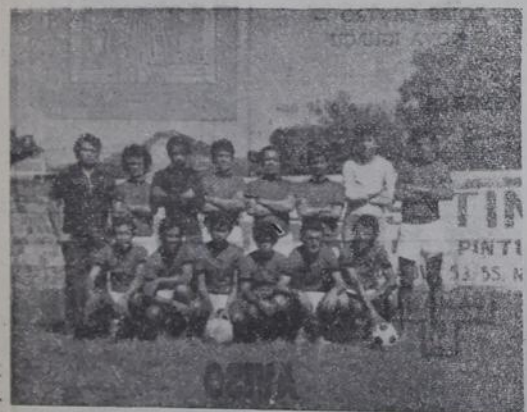
Casas da Banha vai folgar na última rodada, mas já está com o lugar garantido.

Chave A — 1º) Tecidos Teci, 5; 2º) Ponto Frio, 3; 3º) Casas Matos, 2; 4º) Sapataria Pascoal, 0. Chave B — 1º) A Exposição e A Luminosa, 3; 2º) Lojas Americanas, 2; 3º) Baú da Felicidade, 0. Chave C — 1º) Casas da Banha, 6; 2º) Brastel, 4; 3º) Imperatriz das Sedas, 2; 4º) Movenda — eliminado — 0. Domingo, no mesmo local, serão realizados dois jogos pela última rodada do turno de classificação: Sapataria Pascoal x Ponto Frio e A Exposição x Lojas Americanas. O time da A Luminosa folgará na rodada.