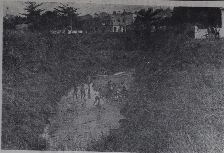
O canal das Botas é, segundo os moradores, um sério perigo, principalmente nos dias de chuva. Para atravessá-lo, só há uma precária piquete por eles construída.

Esperam os moradores que a Municipalidade coloque em uso os novos caminhões, fechados, para que tal fato não continue ocorrendo. "Não recolhem lixo de nosso bairro. O que fazem é deixar cair o que coletam em outras áreas".