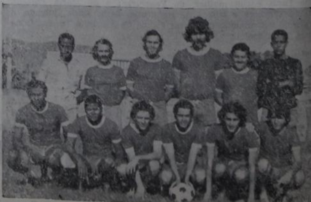
Grças à campanha negativa da Sapataria Pascoal, a equipe do Ponto Frio conseguiu uma vaga no Grupo A.