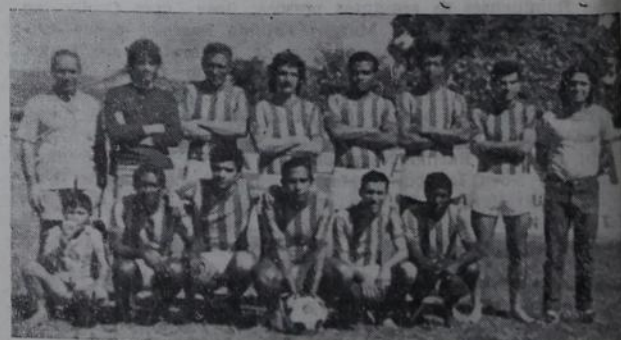
Com apenas um ponto negativo, o time da A Exposição mostrou que está firme na luta pela título.