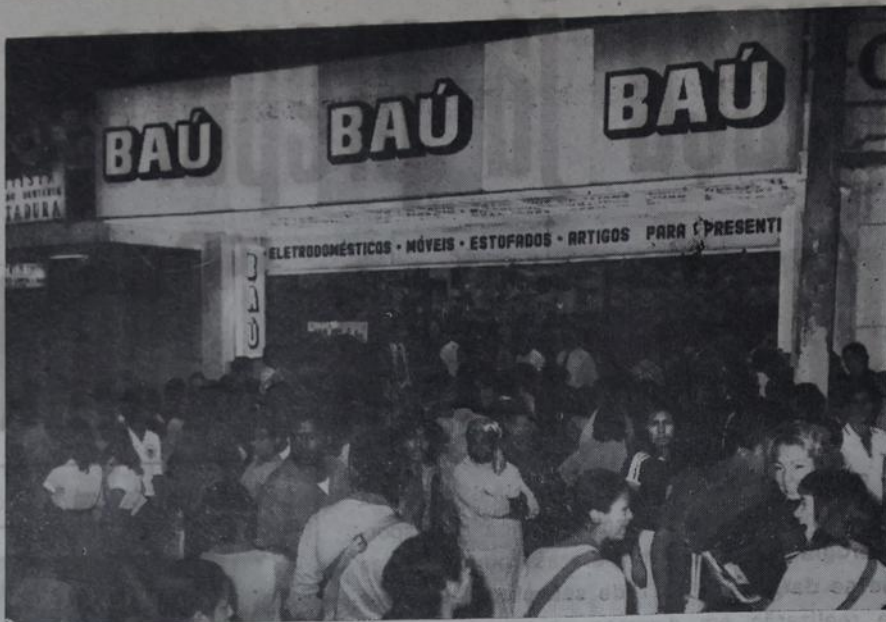
A loja do Baú em Meriti é uma das mais bonitas da cidade.