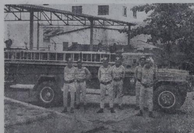
A falta de material para uma perfeita cobertura à grande região de Nova Iguaçu, é compensada pela eficácia dos soldados do Corpo de Bombeiros da Polícia Militar.