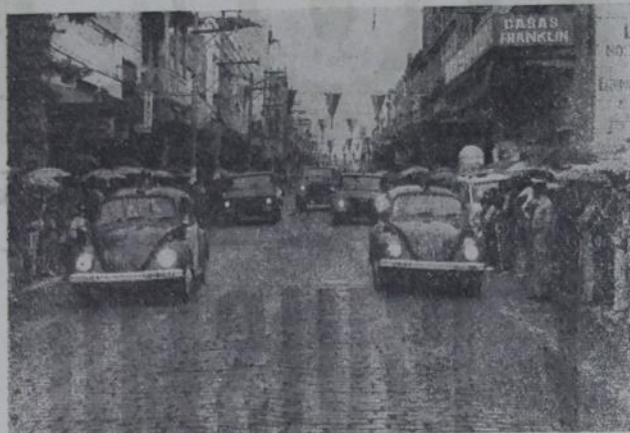
No desfile da Independência, em Nova Iguaçu, a PM mostrou parte de sua força.

Estas informações devem ser rápidas, claras e verdadeiras, a fim de liberar o aparelho da Polícia, para prováveis casos mais urgentes e inadiáveis.