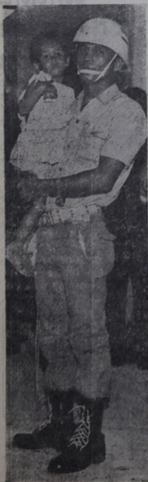
Dedicação e tónica dos soldados da PM.