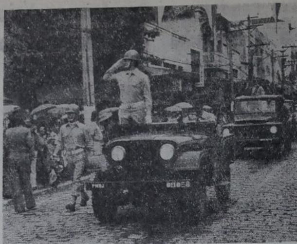
Polícia Militar e Corpo de Bombeiros abriram o desfile em Nova Iguaçu, com seus uniformes de gala. Foram muito aplaudidos.