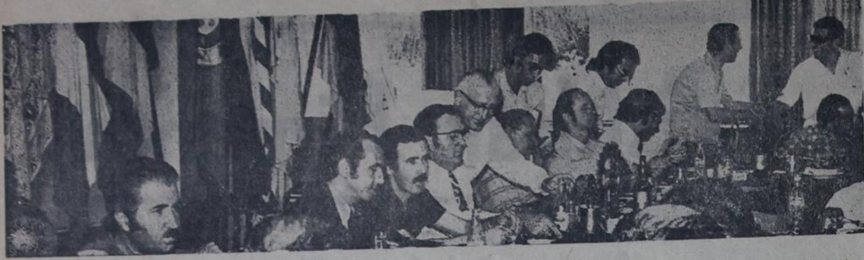
Os encontros rotarianos reúnem a mais elevada representação do progresso do Município, cujas atenções se voltam para os principais problemas da comunidade