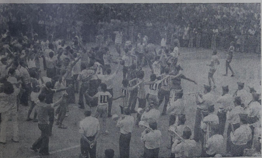
O Carnaval de despedida foi autêntico e vai deixar saudade.

Pague seus impostos em dia, para garantir a continuidade de realizações Até dia 31 de dezembro sem multa