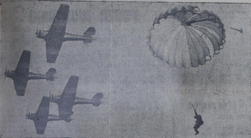
A Esquadrilha da Fumaça e os "Boina Azul" deram um show.