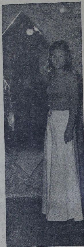
beleza e classe no ano que passou.