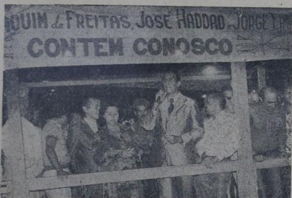
Joaquim afirmou que obra era cumprimento da promessa

O parlamentar Jorge Lima sublinhou que a Arena vem desempenhando o seu papel, pois já se tornou comum o Prefeito entregar, semanalmente, os melhoramentos exigidos pelas classes populares. Ao externar os agradecimentos dos moradores de Belford Roxo ao chefe do Executivo municipal, o 1.º secretário da Assembleia Legislativa acentuou que as ruas Uruguai, Castor, Paraguai e Três, serão pavimentadas pelo governo Joaquim de Freitas, que também vai instalar iluminação pública nas ruas 4, 5, 6, 7 — com luminárias a vapor de mercúrio. “Acabou-se o tempo de enganar — disse — para completar — estamos cientes de uma realidade que nos deu condições de implantar um volume de obras há muito reivindicado. A demagogia deu lugar a um trabalho de urbanização de todos os bairros, seja no setor de saneamento básico, na construção de novas vias de acesso ou na ampliação de escolas”.