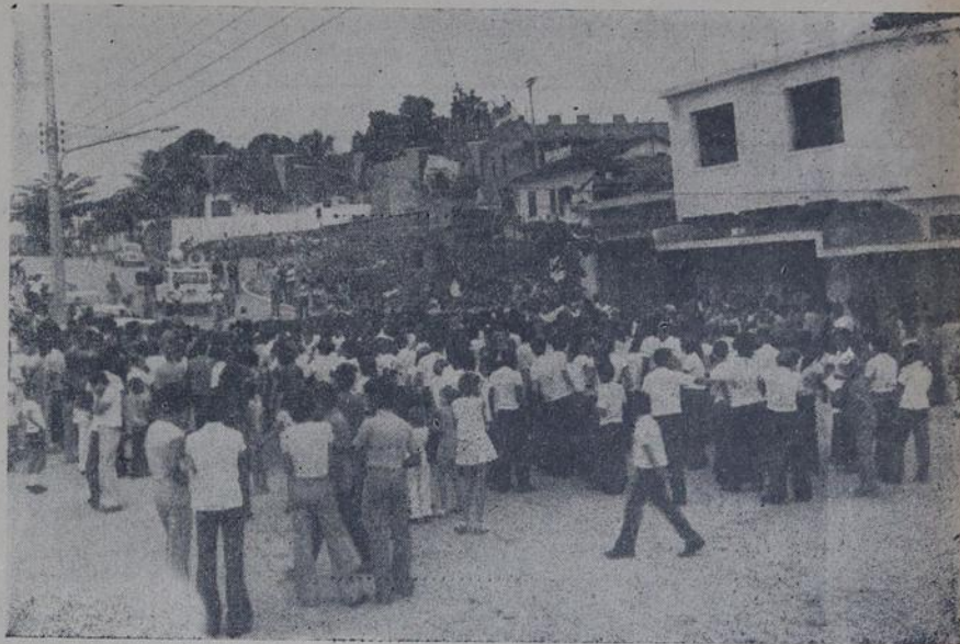
O povo fez questão de apertar a mão de seus líderes