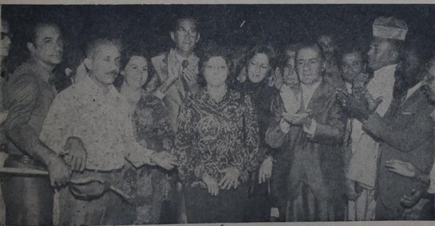
O corte da fita significa o climax da realização de almejada obra

Ainda em Belford Roxo, o Prefeito foi homenageado no Ginásio Municipal Floripes Rocha, por ocasião do seu aniversário, com um bolo de quatro metros quadrados, feito por moradores locais.