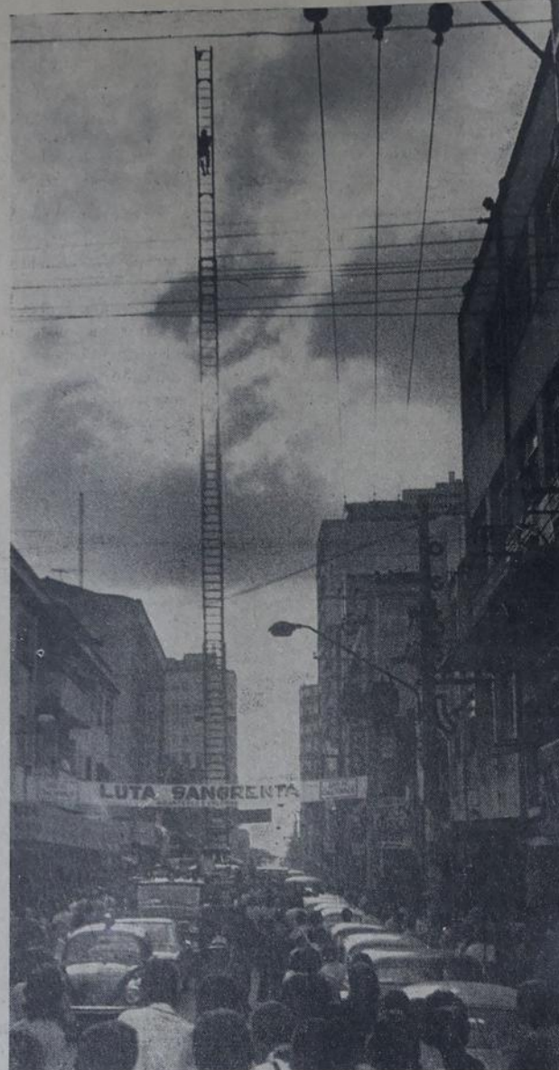
O Desfile da «Magirus»