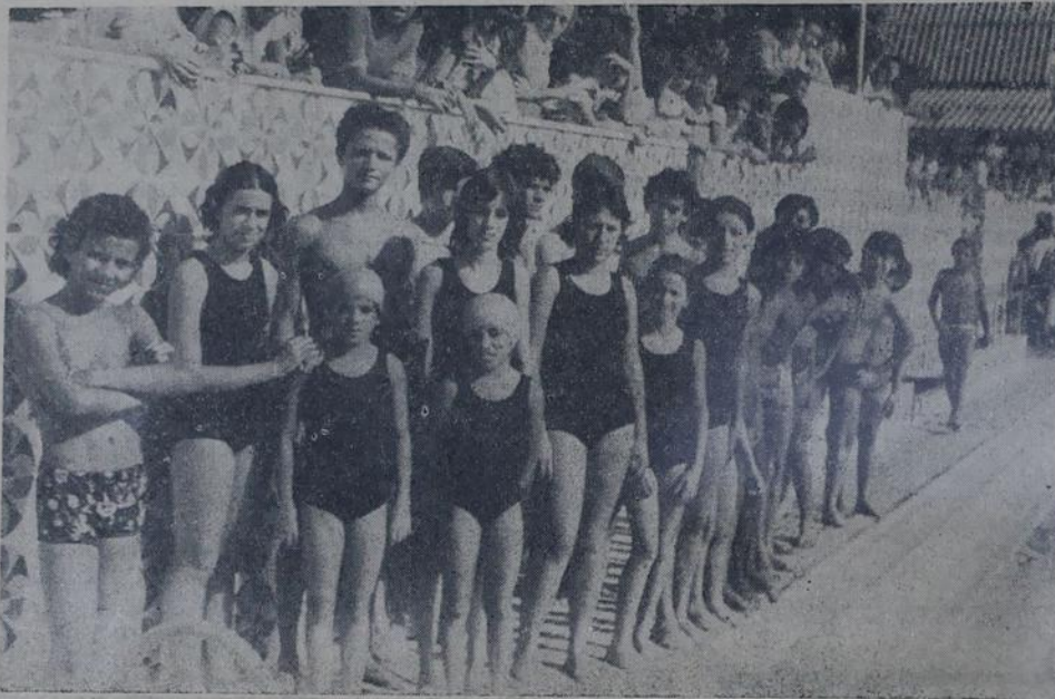
A natação do Instituto Brasil é atração no encerramento da Semana de Tiradentes