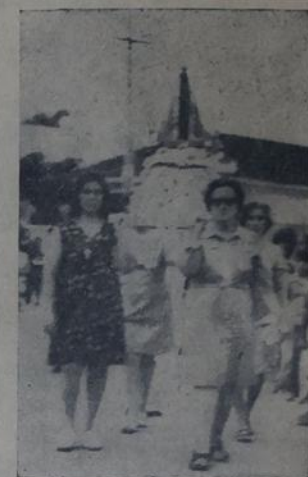
Fiéis transportando a imagem de N.S. Aparecida durante a procissão.