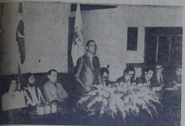
A Coordenadora do Movimento Brasileiro de Alfabetização fala sobre o porque da solenidade e agradece as cooperações recebidas por parte dos agraciados com os Diplomas de Mérito.