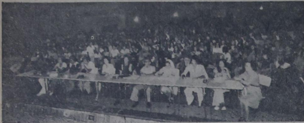
Juri responsável pela escolha das melhores canções no I Encontro da Canção do I.E.S.A.