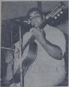
Um violão, uma voz é muito talento.