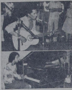
Os concorrentes tiveram bom desempenho e agradaram o público com músicas onde prevaleceu o bom gosto.