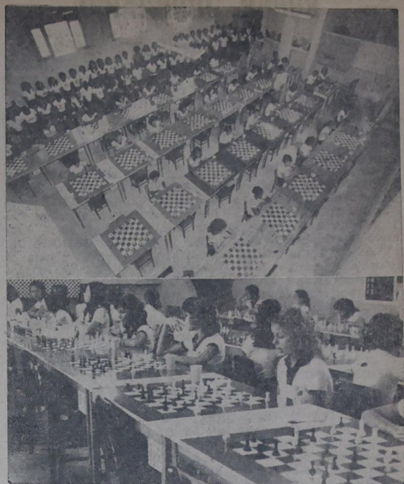
Vista do salão de xadrez do C.A.P.