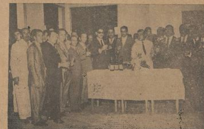
Outro aspecto do brinde.