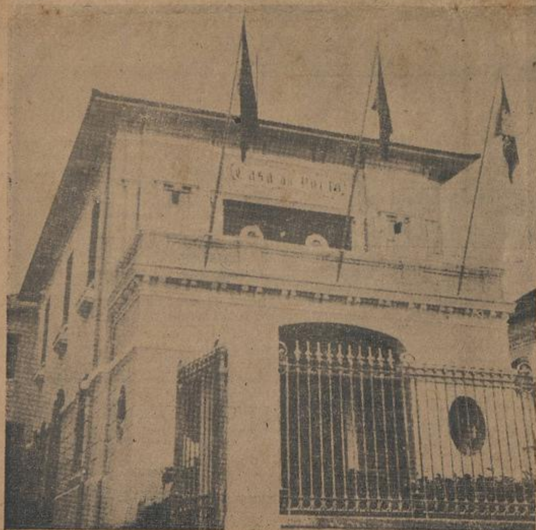
No dia 18 de dezembro de 1957, foi inaugurado com toda a solenidade, o novo edifício da "Casa do Porto", na Rua Afonso Pena, no elegante Bairro da Tijuca. Em casa própria se instalou, portanto, vindo da Avenida Rio Branco, o magnífico organismo regional, orgulho da Capital do Norte