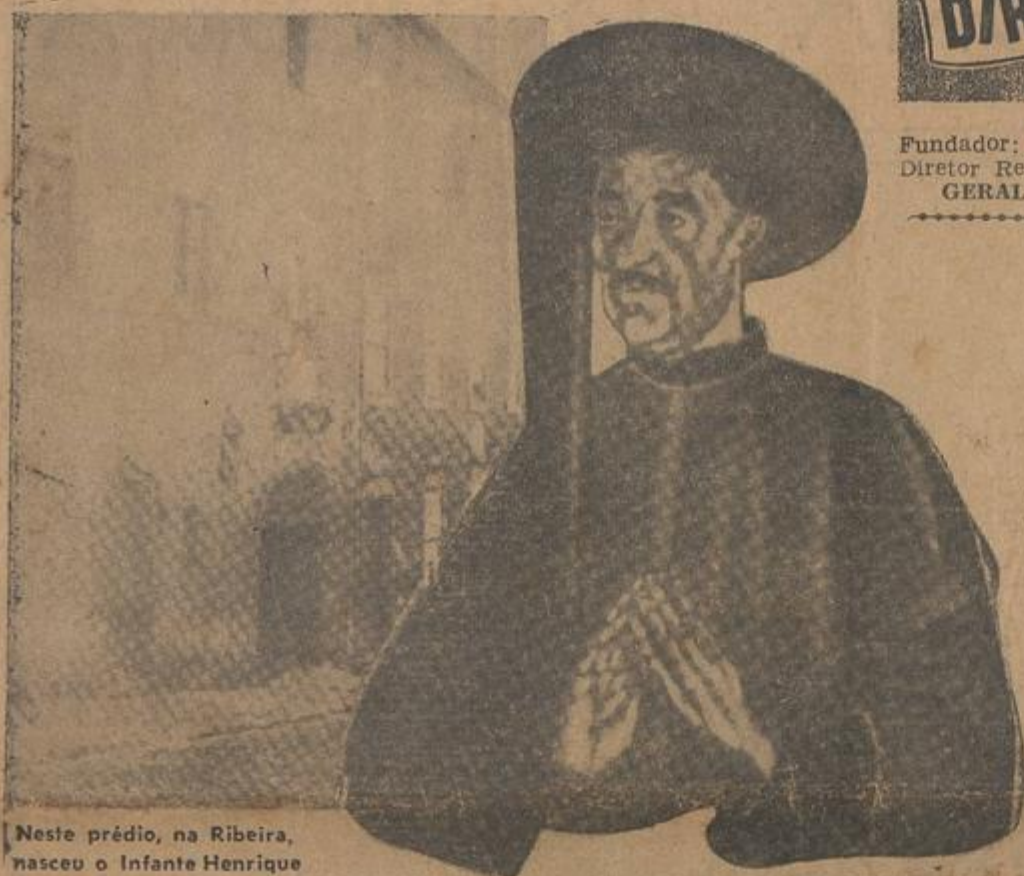
Neste prédio, na Ribeira, nasceu o Infante Henrique