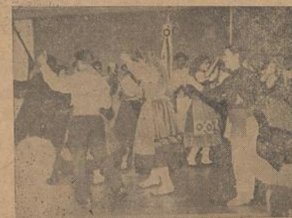
Um aspecto da dança típica lusitana, apresentada pelos componentes da "Casa do Porto".

Foi uma festa lindíssima, com o fundo musical de guitarradas, viras, canções lusas, a notável voz do fabuloso e simpático Francisco José e a bonita decoração de Alberto Cavalcanti (e expressiva também). — (Cont. na 2.ª pág.).