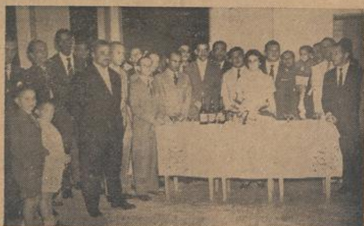
O brinde reuniu muita gente. E a champagne era da melhor.