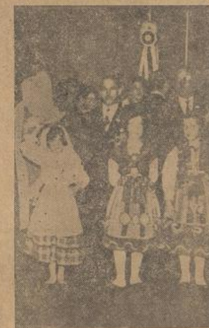
No flagrante, artistas da "Casa do Porto" quando homenageados pela direção do Nova Iguaçu Country Club.