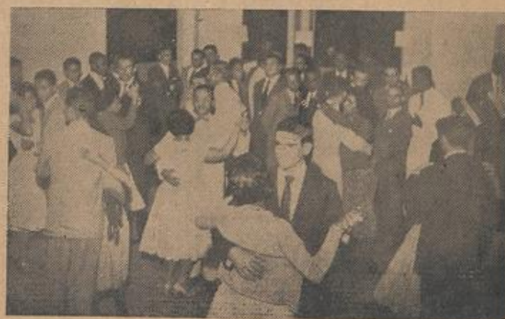
Aspecto do animado baile.