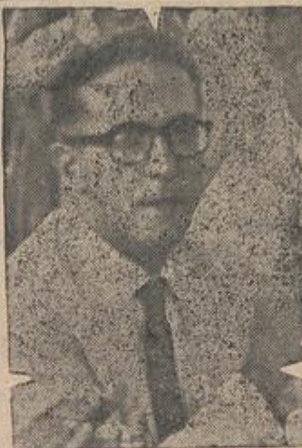
Gov. Carlos Lacerda