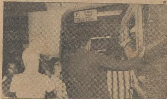
Flagrante da invasão ao ônibus da empresa