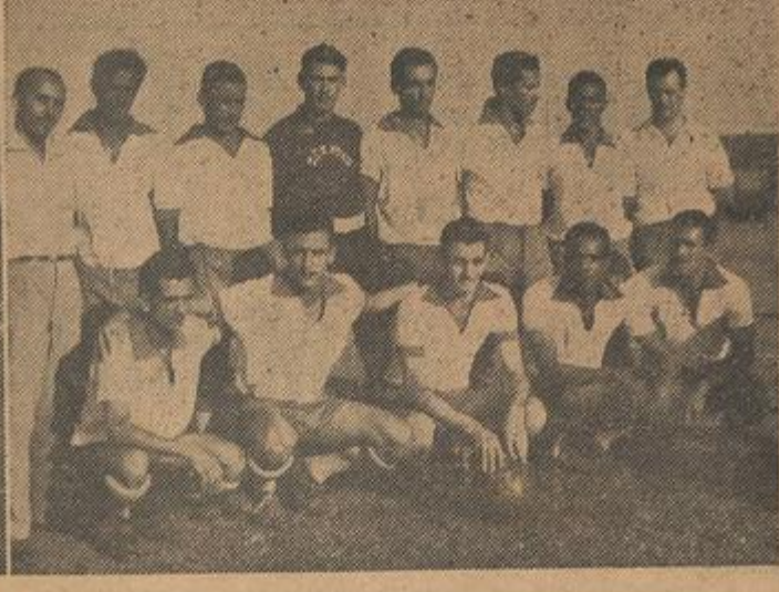
A nossa objetiva gravou no Estádio Coelho da Rocha o primeiro goal do Belford Roxo e, por fim, o quadro do Belford Roxo