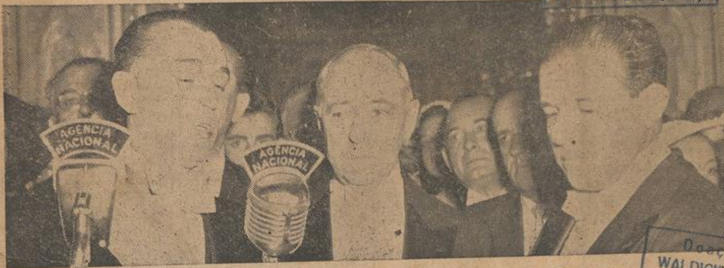
O presidente Juscelino Kubitschek de Oliveira, logo após receber a faixa presidencial, dirige, de improviso, uma palavra ao seu antecessor

O que foi a cerimônia da transmissão — Nereu Ramos (cansadíssimo) esperou o novo Presidente à porta do Palácio — Impossível a entrevista coletiva — A primeira ordem — O novo ministério do Brasil