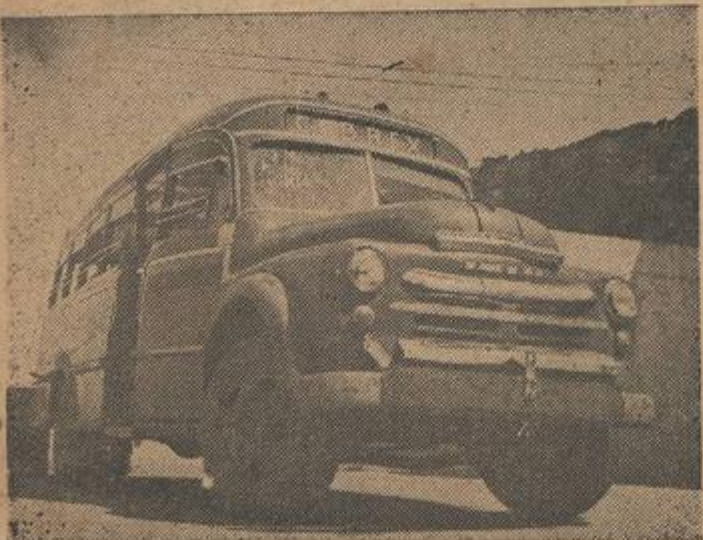
A camioneta, perfeita em tudo, mas que, graças a inépcia da I. G. T. P. fez um cadáver