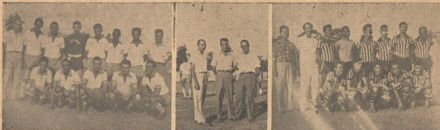
No clichê acima, da esquerda para a direita, aparecem, o quadro do S. C. Belford Roxo, ao centro, o técnico e diretores dos alvi-anis, e, por fim, a equipe do Cocotá F. C.

Domingo 19, o S. C. Belford Roxo receberá a visita do S. C. São Diogo (Campeão do torneio início dos Ferrovários).