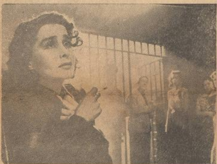
As grades de uma cadeia são suficientes para impedir que a mulher peque?

Passa-se o contrato de uma casa Comercial, com residência, explorando o ramo de sorveteria.