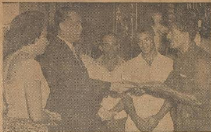
Os jangadeiros diante do Presidente e Sra.

então que iria esperá-lo em Washington e ficaria altamente honrado se o sr. João Goulart se dignasse estender sua visita a Kansas City, porquanto, quis cou para ser acertado posteriormente.