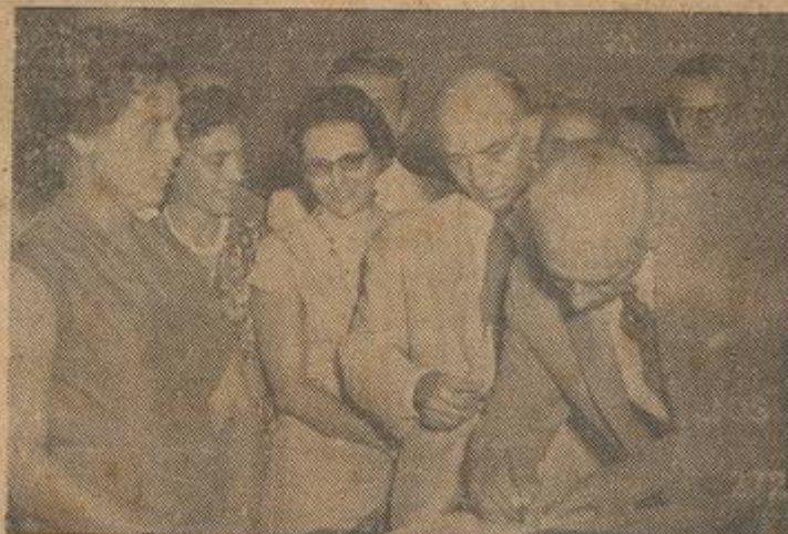
TOMOU POSSE, NO DIA 5 O NOVO DIRETOR DO D.N.E.R.

ALGUMA COISA DE ESPETACULAR QUE OS LEITORES DE "O IMPARCIAL" ENCONTRARÃO NA QUARTA PAGINA