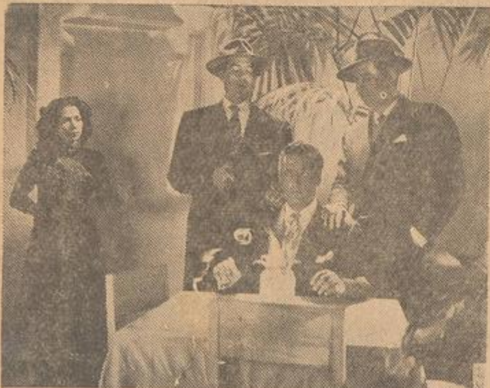
Abel Salazar, o galã do cinema mexicano numa das emocionantes cenas de "Por Que a Mulher Peca"

"POR QUE A MULHER PECA" — UM FILME QUE FARÁ VIBRAR O EMOTIVO ESPECTADOR BRASILEIRO