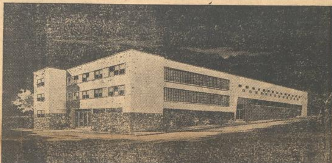
Uma visão do que será o novo palácio de Nova Iguaçu

Vão ter início imediatamente as obras do magestoso edifício em que funcionarão a Delegacia de Polícia, a Cadeia Pública e a Inspetoria de Trânsito -- O governador Amaral Peixoto, no seu ciclópico plano de obras públicas, contempla satisfatoriamente o município de Nova Iguaçu