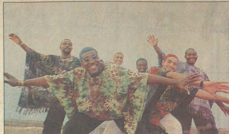
• O grupo de pagode se apresenta hoje no Robertão de Mesquita