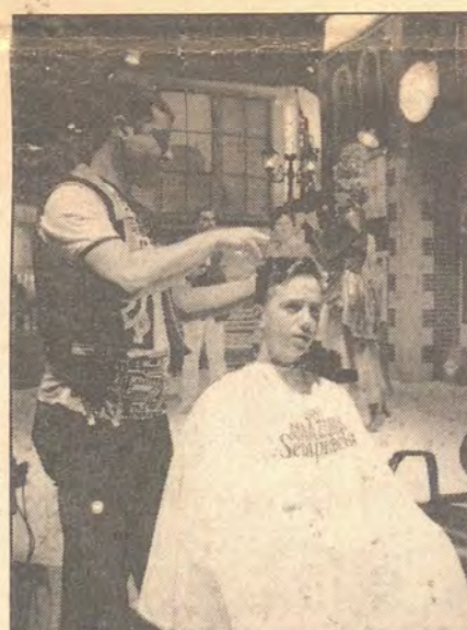
Profissionais cabeleireiros demonstraram, ao vivo, a performance dos produtos Embeleze