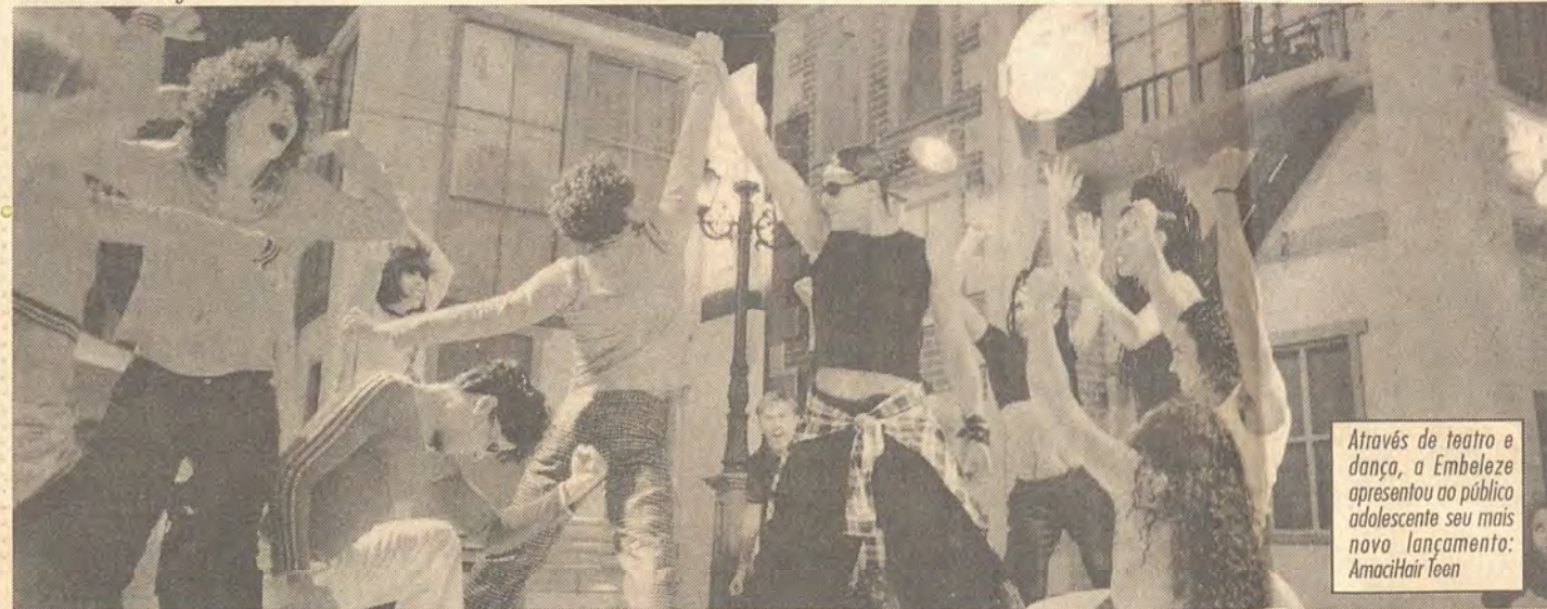
Através de teatro e dança, a Embeleze apresentou ao público adolescente seu mais novo lançamento: AmaciHair Teen

Imagine um mundo onde a beleza tenha múltiplas possibilidades. Um planeta sem padrões estéticos pré-estabelecidos, onde é possível realçar a beleza humana, seja ela branca, negra, índia etc. Este universo existe e foi batizado de Planeta Embeleze - o jeito criativo e irreverente que a Embeleze encontrou de apresentar ao público da Cosmoprof Cosmética a universalidade de sua missão em realçar a beleza humana, mais especificamente, a beleza da raça brasileira.