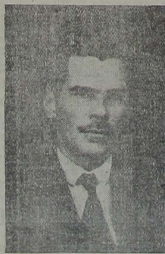
CAP. PAULINO BARBOSA Prefeito do Município

Fala ao CORREIO DA LAVOURA, reafirmando o seu propósito de se dedicar inteiramente á administração municipal, o prefeito Paulino de Sousa Barbosa