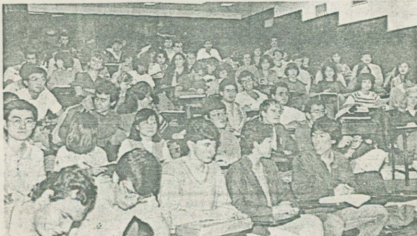
Pobre ou rico, pagando ou não, no Brasil, quem chega à universidade é um privilegiado

V irou, mexeu, volta à baila a discussão sobre o fim da gratuidade do ensino superior. O simples pagamento de mensalidades pelos alunos "que podem" para sustentar os "que não podem" é apresentado, pelos defensores da idéia, como uma espécie de panacéia para resolver os crônicos problemas do ensino público e como única solução para possibilitar o acesso, à universidade, da imensa legião de estudantes de menor nível de renda. O atual governo, de