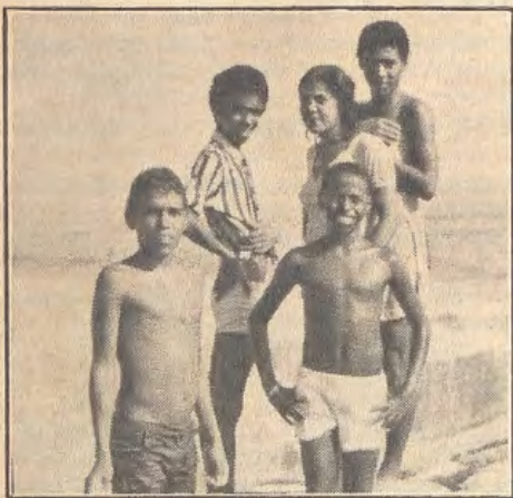
O Brasil jovem tem futuro? (leia pág.11)

10 Luta pela terra (3º cap.) A ASPAS se renova nos ideais e na metodologia