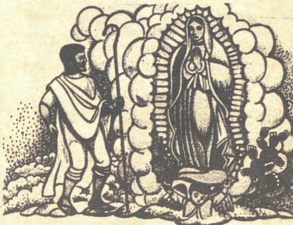
S. Juan Diego e N.S. de Guadalupe

O acontecimento se reveste de um sentido muito especial porque propõe ao povo mexicano, em particular à Igreja, a questão da marginalização de 23,5 milhões de índios, primeiros habitantes daquela região.