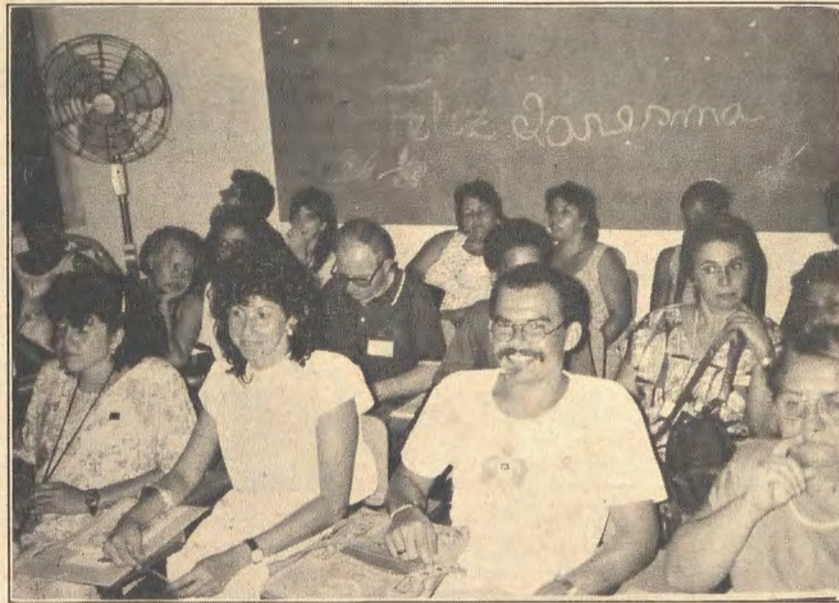
Um momento da assembléia da ASPAS...

A ASPAS está ao serviço do povo da Baixada Fluminense; quer se fazer disponível a todos que, sem discriminação alguma, aceitem ou solicitem sua solidariedade e seus serviços.