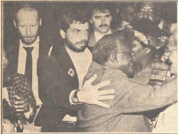
Os cristãos de todo o mundo cada vez mais unidos pela justiça.

Em 1983, em Vancouver (Canadá), na sua 6ª Assembléia, os representantes das Igrejas sentiram que era urgente a participação do movimento ecumênico no enfrentamento decisivo de três dramáticas realidades: o crescimento de situações de injustiça no mundo (exemplo: o aumento da pobreza e da miséria), a impossibilidade de uma paz duradoura enquanto existirem as atuais situações de desigualdade e de opressão, e a louca destruição da natureza.