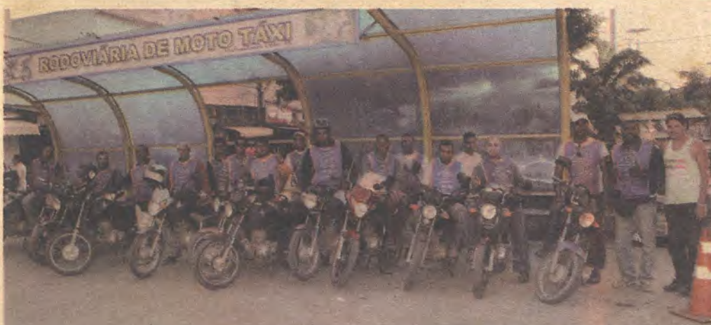
Uma Cooperativa que Deu Certo

Rua Voluntários da Pátria, 120 Botafogo Cep.: 22270-010- Rio de Janeiro www.fia.rj.gov.br