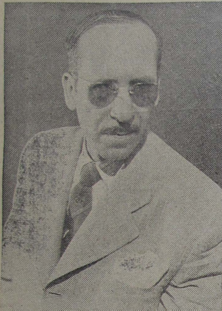
PINHEIRO VICTORY Candidato do Comércio e da Lavoura

Apresenta-se como candidato a Vereador pela UDN O FARMACEUTICO