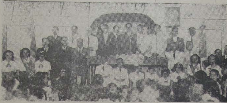
Mesa que presidiu à sessão de encerramento do ano letivo