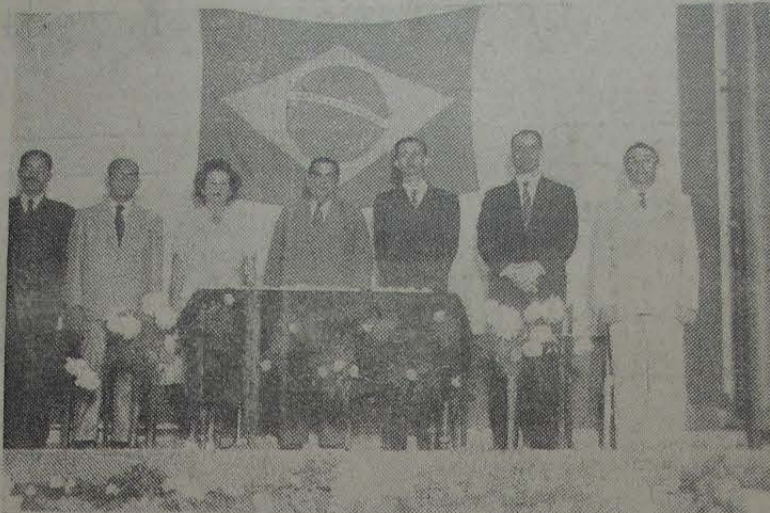
Mesa que presidiu, no Cine-Teatro Imperial, à sessão de encerramento do ano letivo no Instituto Filgueiras

Quarta-feira, dia 20 deste, perante numerosa assistência, o Instituto Filgueiras de Nilópolis realizou, no Cine-Teatro Imperial, a festa de encerramento do ano letivo de 1944, a qual constou de uma sessão solene e outra artística.