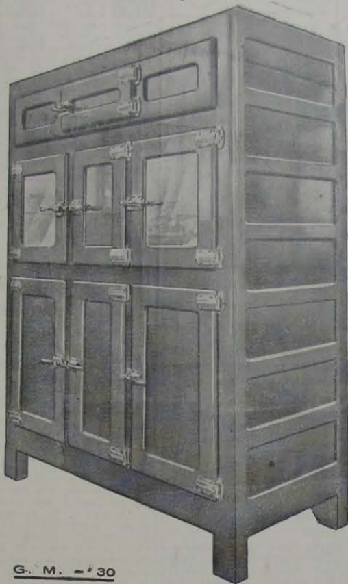
G. M. - 30