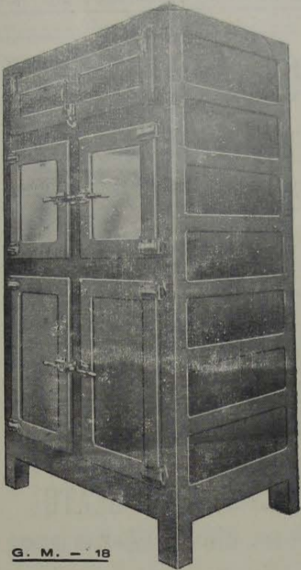
G. M. - 18