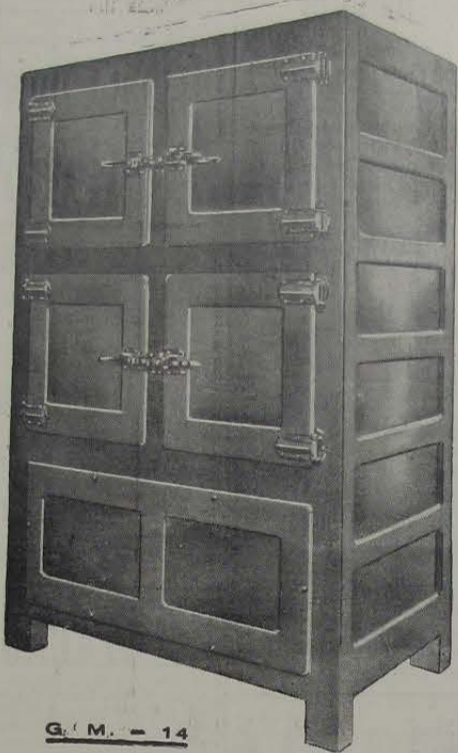
G. M. - 14