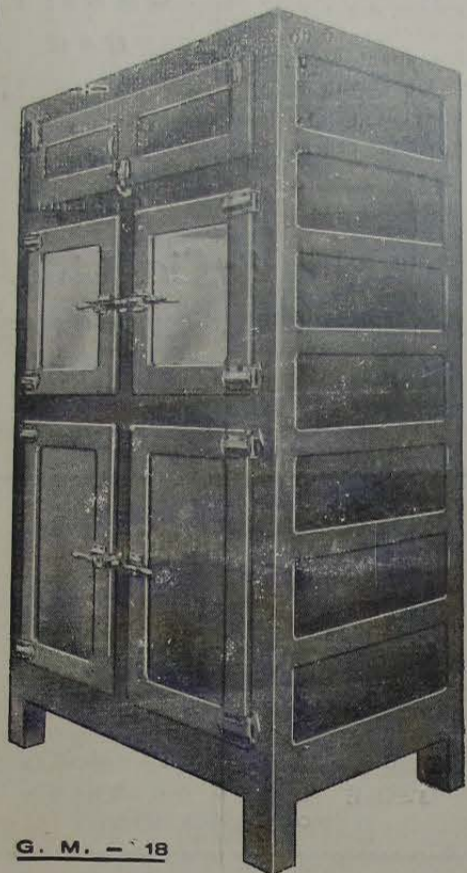
G. M. — 18

Compressores "FRIGIDAIRE" GELADEIRAS COMERCIAIS—BALCÕES— GELADEIRAS DOMESTICAS, ETC. A VISTA E A PRAZO