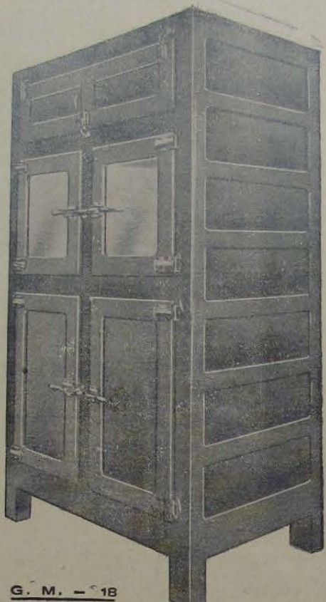
G. M. - 18