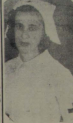
Para Vereador Aliança Trabalhista Democrata