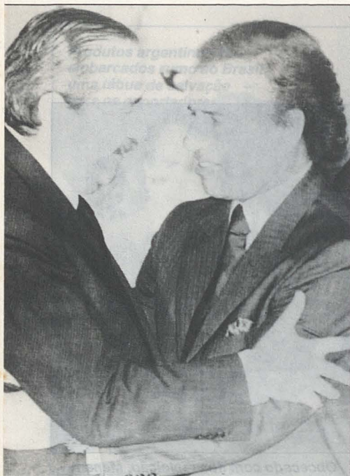
Alfonsín e Menem: abraço sela acordo