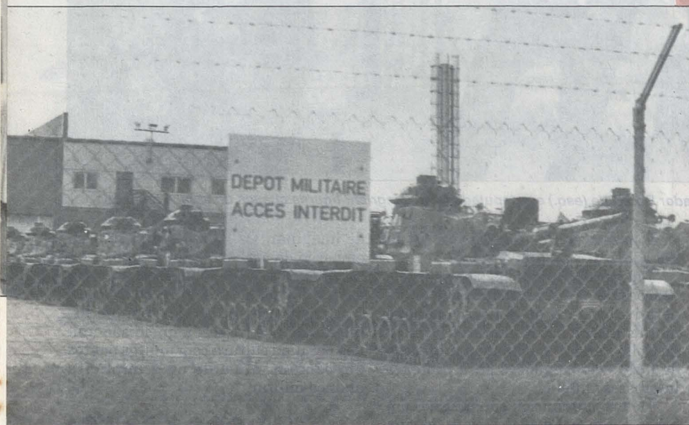
A ampliação da Otan para incorporar os países do Leste envolve complexos fatores