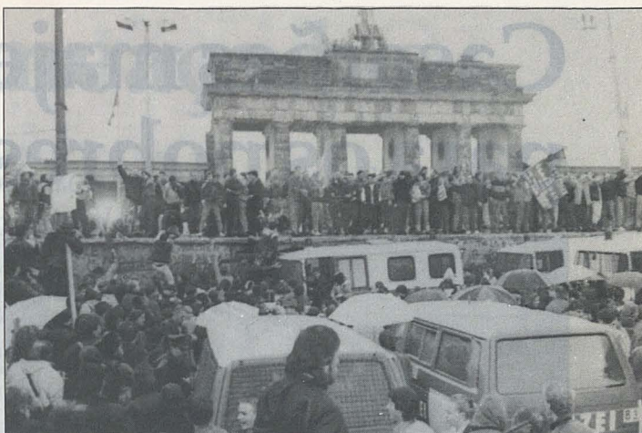
A queda do Muro de Berlim, em 1989, anunciou o fim de uma era

Sistema de segurança viável – Porém, um esquema de transição em duas etapas seria possível. Se as nações